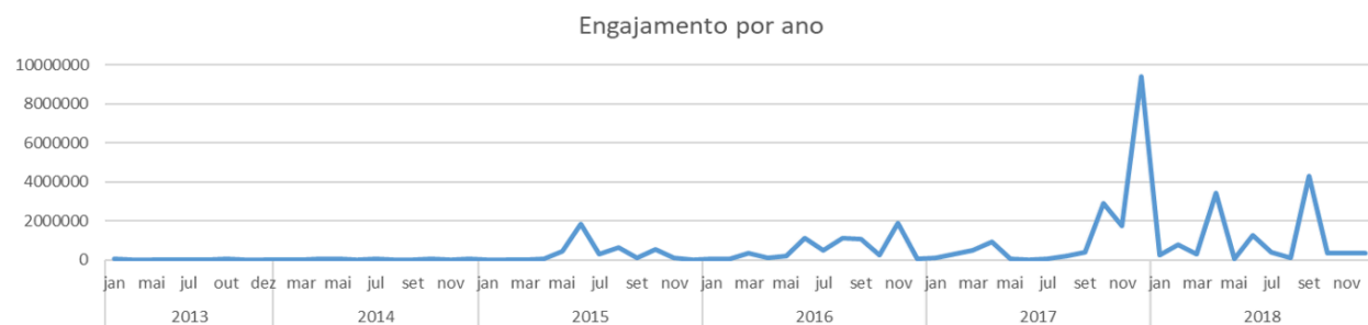
Gráfico 2: Engajamento em relação a vídeos com a menção à “ideologia de gênero” no título

Os dados servem como indicadores de aumento e diminuição do interesse pelo tema. A proliferação e retração dos vídeos sinalizam quando a “ideologia do gênero” estava na agenda das discussões da plataforma. Encontram-se menções à “ideologia de gênero” em 2013, mas a preocupação persistente com o tema se consolida em 2015, alcançando o pico no final de 2017 4 . Os dois gráficos acima elucidam o aumento tanto na produção de vídeos sobre o tema da “ideologia de gênero” quanto no consumo desses vídeos no período entre maio e junho de 2015, época em que os planos de educação estavam sendo debatidos e votados na esfera municipal.