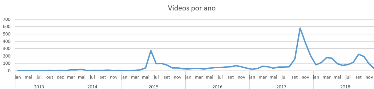
Gráfico 1: Vídeos com menção à “ideologia de gênero” no título

O recorte temporal da pesquisa partiu de uma base de dados extraídos pelo aplicativo YouTube Data Tools 3 que permitiu uma visualização panorâmica da menção à “ideologia de gênero” na plataforma YouTube até as eleições de 2018, sendo publicados aproximadamente 25 vídeos sobre o tema em maio de 2014, 300 vídeos entre maio e julho de 2015 e 600 vídeos em outubro de 2017, conforme demonstrado na Figura 1 e Figura 2.