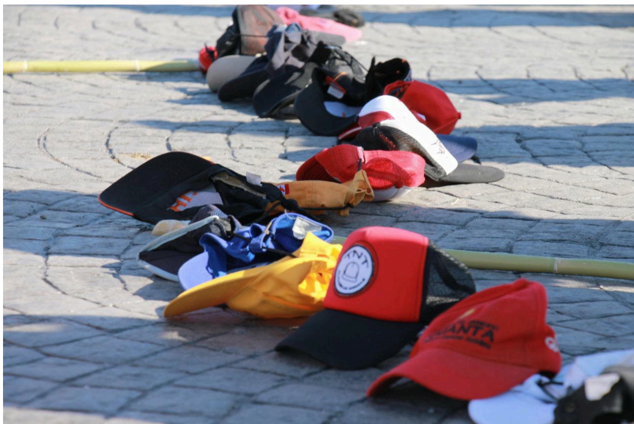
Figura 3: Intervención artística con gorras en la 13ª edición de la Marcha de la Gorra.

En este sentido, vale explorar la potencia de la acción colectiva para subvertir los sentidos hegemónicos acerca de las juventudes populares. En el ejercicio performático de la Marcha se construyen nuevas imágenes, simbolismos, metáforas que colaboran en la resemantización de algunas representaciones. El espacio público se presenta como un escenario clave para la puesta en acto de prácticas heterodoxas que, en ocasiones, pueden adquirir la forma de imágenes o relatos que disputan la representación de la realidad, la legitimidad y el poder. Veamos, por caso, lo que ocurre con el objeto-símbolo gorra . En esta movilización, una de las expresiones más potentes está dada por el uso de gorras o viseras que, en efecto, dan nombre a la Marcha. Como ya señalamos, la gorra suele ser uno de los elementos de vestuario que dispara la sospecha policial. Sin embargo, la gorra tiene una potencia simbólica particular en esta acción colectiva. De hecho, se produjeron un gran número de intervenciones artísticas empleando este elemento. Para citar un ejemplo, en la 13ª edición (año 2019), la mesa organizativa de la Marcha comenzó una campaña de donación y recolección de gorras para elaborar una instalación artística de gran tamaño. El día de la movilización, se colocaron varas de gran altura conectadas por un hilo en el que pendían decenas de gorras. Esta intervención fue exhibida durante la movilización y, al finalizar, permaneció instalada en la calle donde se realizó el festival de cierre.