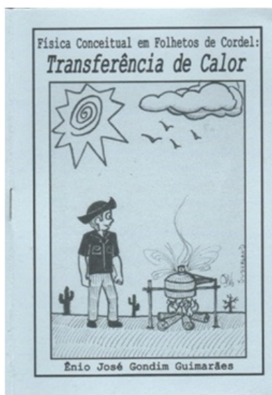
Figura 3: Folheto de Cordel utilizado durante a oficina.