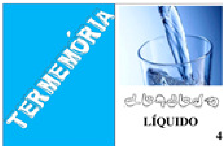
Figura 4: Carta-exemplo utilizada para o conceito LÍQUIDO.

Cada carta tem o formato retangular com nove centímetros de comprimento e sete centímetros de largura e tem no verso a cor azul claro e o nome do jogo em letras brancas, de modo a indicar o sentido de orientação das cartas. As cartas apresentam uma imagem colorida, a datilologia do nome do respectivo conceito em Libras e em Língua Portuguesa e o número que representa o grupo ao qual a carta pertence no canto inferior direito.