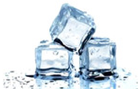
Figura 2: Imagem utilizada na carta-exemplo 'SÓLIDO'.

como imagens, ilustrações ou vídeos com legenda. Utilizou-se também no jogo, com o objetivo de reforçar o uso das línguas, o nome dos conceitos em Língua Portuguesa, e em Libras, por ser a língua própria dos alunos com deficiência auditiva, e isso propicia aos alunos ouvintes um contato mais próximo com a Língua de Sinais, que muitos só passam a conhecer na convivência com alunos surdos, e um maior contato dos alunos com deficiência auditiva com a Língua Portuguesa.