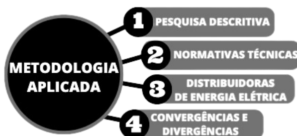
Figura 1. Etapas da metodologia desenvolvida.