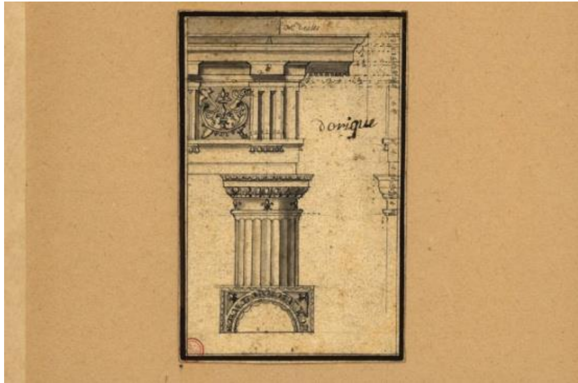
Fig. 2. [Estudo arquitectónico]: [entablamento da Ordem Dórica] [17--]. - 1 desenho: tinta da china e aguadas; 82 x 12,7 cm