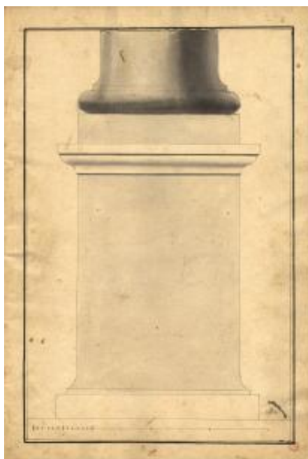
Fig. 1. [Caderno de desenho arquitectónico] : [estudos] [entre 1750 e 1800]. - [I], 26 f.: 26 desenhos a tinta da china e aguadas; 43 x 30 cm. Biblioteca Nacional de Portugal.

Esta ordem Coríntia pa. Se fazer se ade devidir toda a altura em trinta e duas partes os quas se lomeio por moldes. Estes models se devidem Em 48 partes iguais cada hu... sem pedestaç se ade de dar de largo o vão do Arco... conforme Vignola folhas”... (apud Carvalho, 1977: 53)