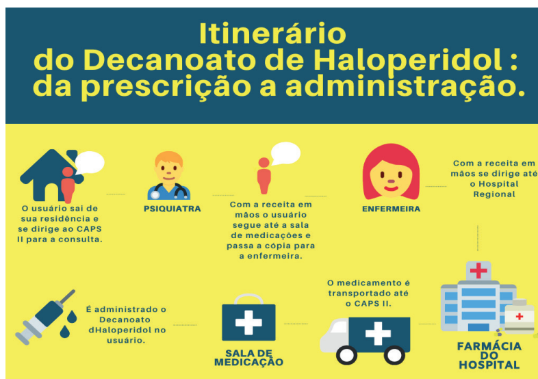
Figura 2: Itinerário do Decanoato de Haloperidol: da prescrição a administração:

Para melhor visualização foi feito uma imagem que ilustra esse itinerário, conforme aprestada na imagem 2.