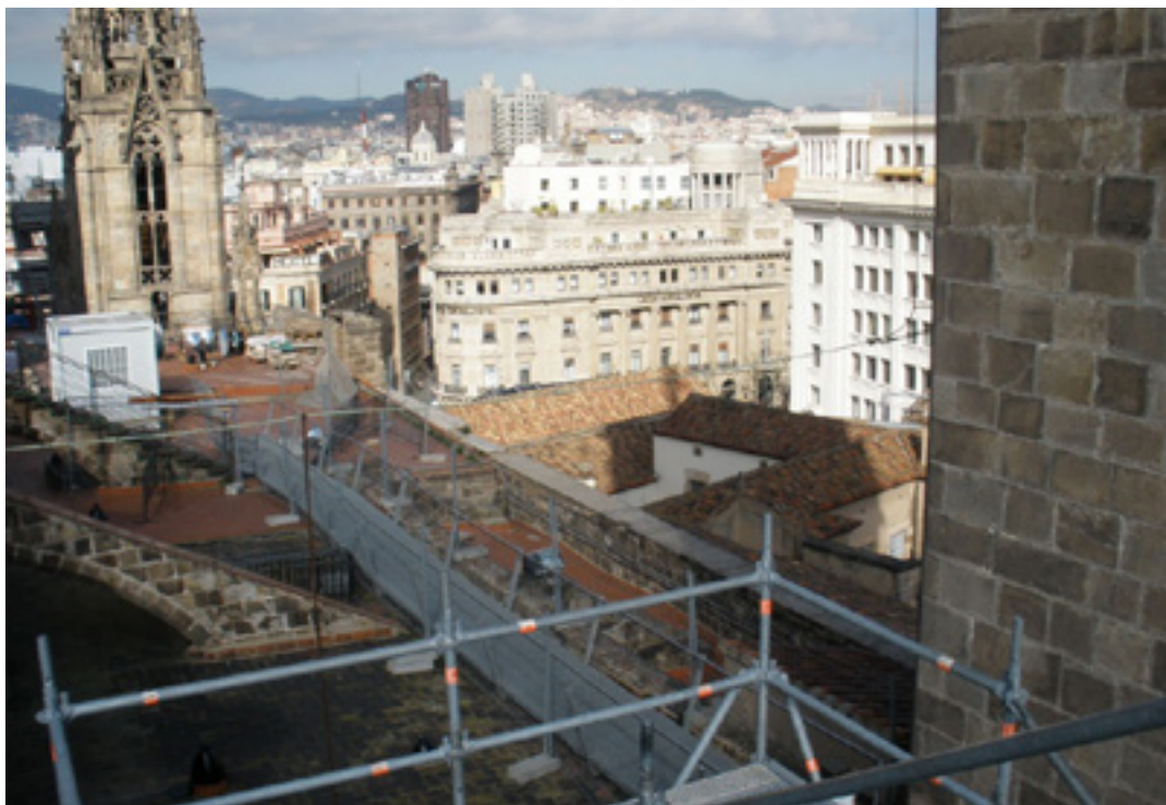
Imagen 3: Plataforma superior de las terrazas de la Catedral de Barcelona