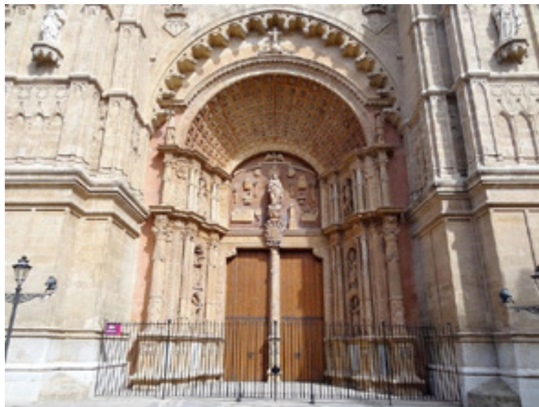
Imagen 2: Acceso a la Catedral de Palma de Mallorca