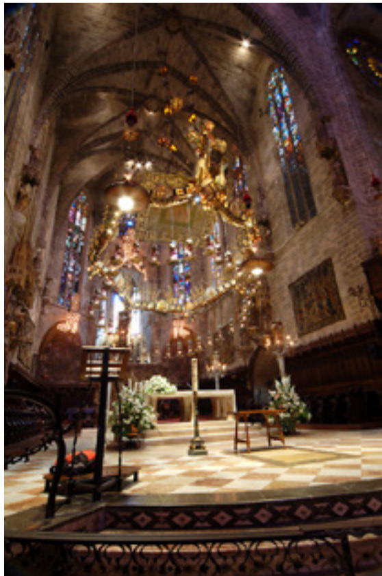
Imagen 5: Altar mayor con baldaquino de la Catedral de Palma de Mallorca