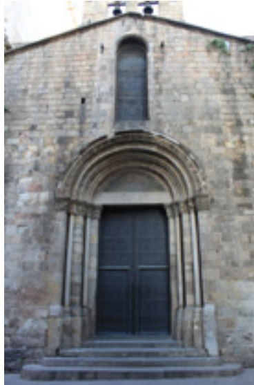
Imagen 1. Acceso a la Catedral de Barcelona