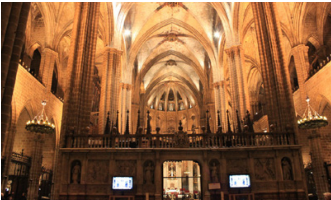
Imagen 4: Información de carteles y televisores Catedral de Barcelona