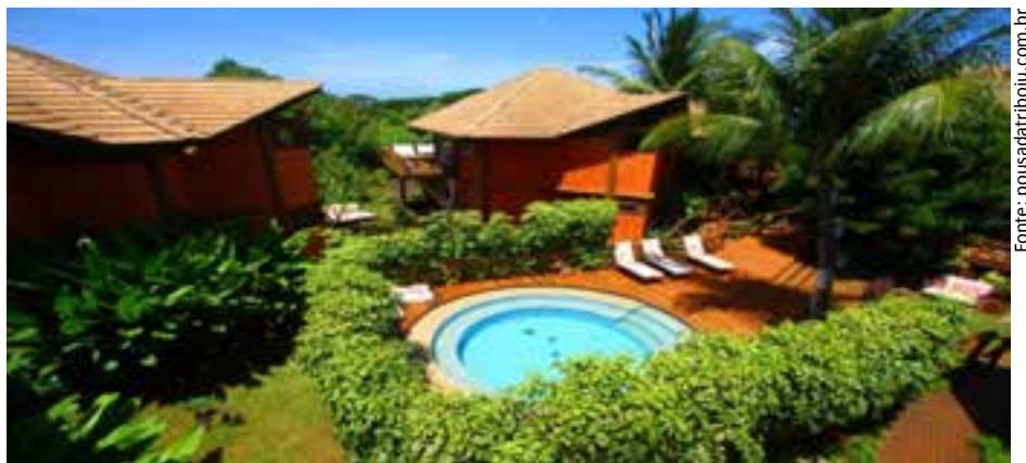
Existem atualmente em Fernando de Noronha mais de 130 meios de hospedagem