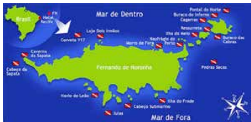
Vista da Bahia dos Porcos e Mapa de Mergulho