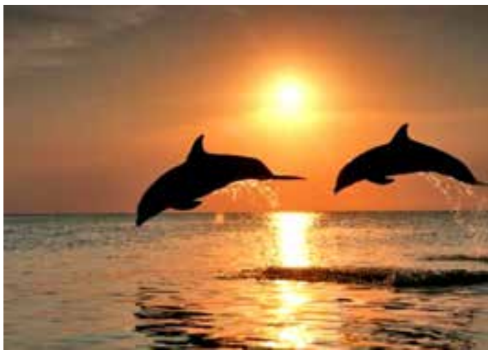
Os golfinhos oferecem um espetáculo à parte

A fauna marinha também oferece outro espetáculo aos visitantes, são os “Golfinhos Rotadores”, conhecidos por este nome devido aos saltos com a rotação do corpo, que costumam executar fora da água. Vivendo no arquipélago, costumam acompanhar as embarcações de turistas em seus passeios e fazer o seu show. Existe um projeto que estuda e protege esses simpáticos animais, existindo na ilha principal, uma baía só para eles, para onde retornam ao final do dia, voltando a sair pelas manhãs. Sendo proibida a navegação e mergulho sem prévia autorização no local, existe um mirante, de onde os turistas podem observar toda a movimentação dos golfinhos, especialmente cedo pela manhã.