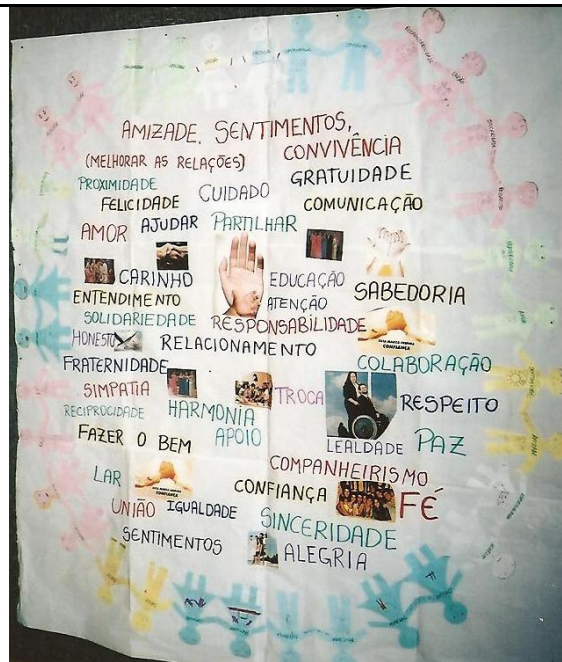
Cartaz sobre amizade apresentado na amostra de trabalho de Toledo/PR