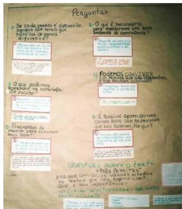
Painel com as perguntas dos alunos e suas reflexões. Exposição na E.B.M. Miriam D. Meyer, Chapecó/SC