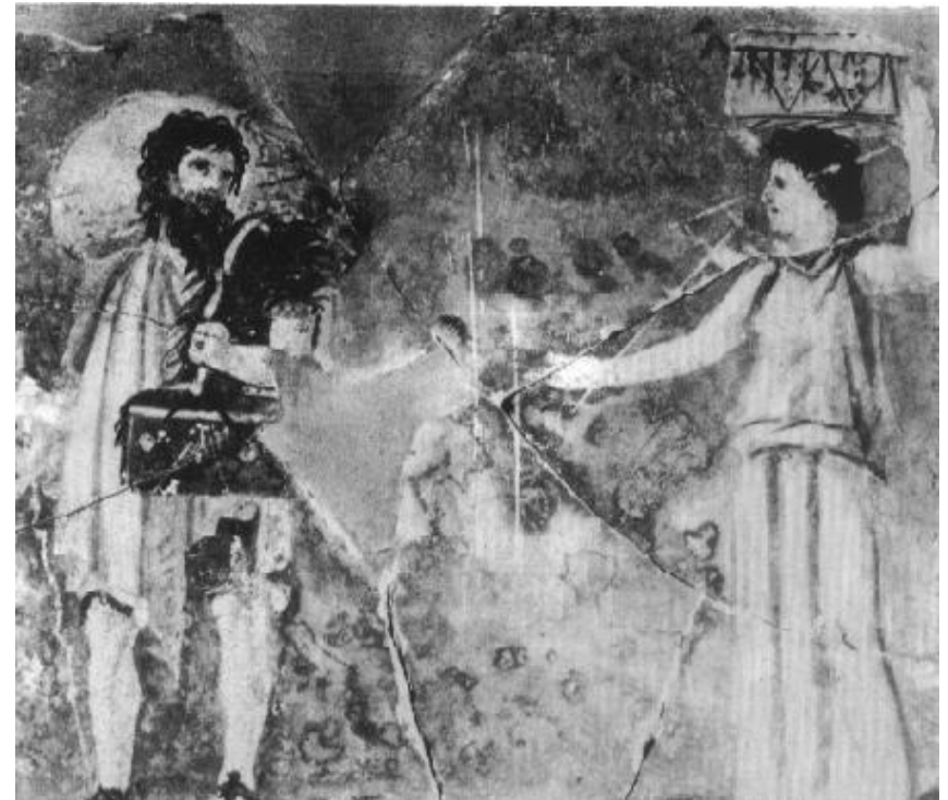
Museo delle Terme, quadro de La Farnesina representando Crates e Hiparquia