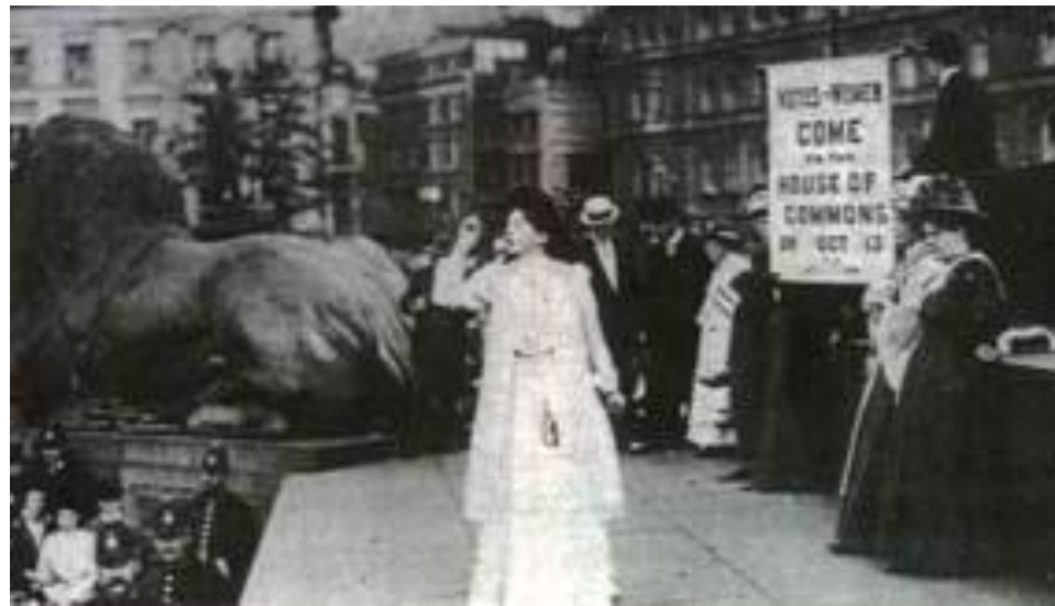
Foto: O direito ao voto. Reivindicação do movimento sufragista da Inglaterra.1866