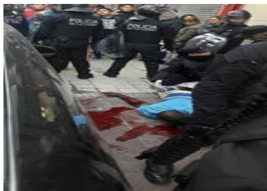
Fotografía 2 (Buenos Aires)