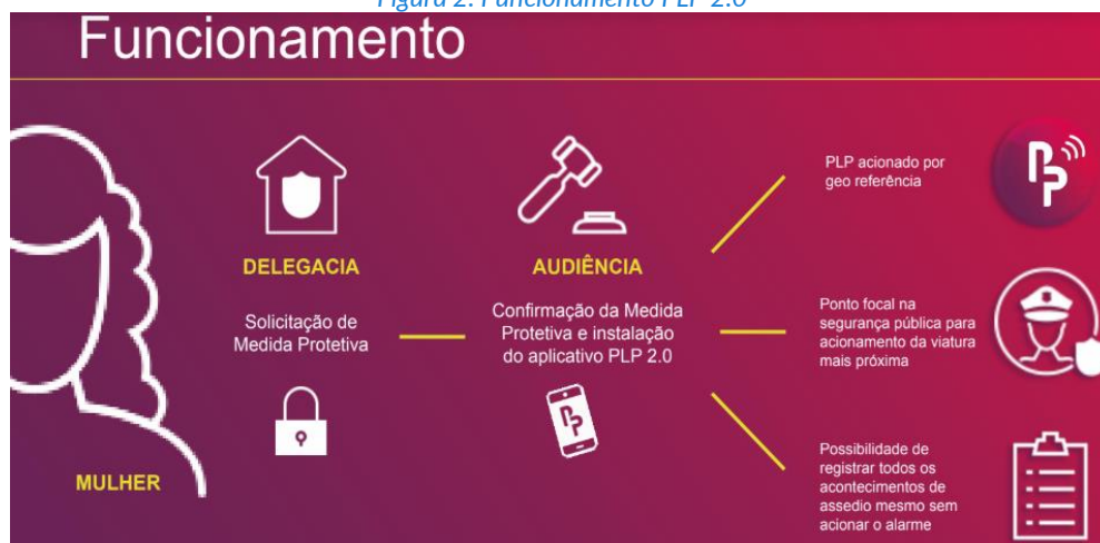
Figura 2: Funcionamento PLP 2.0