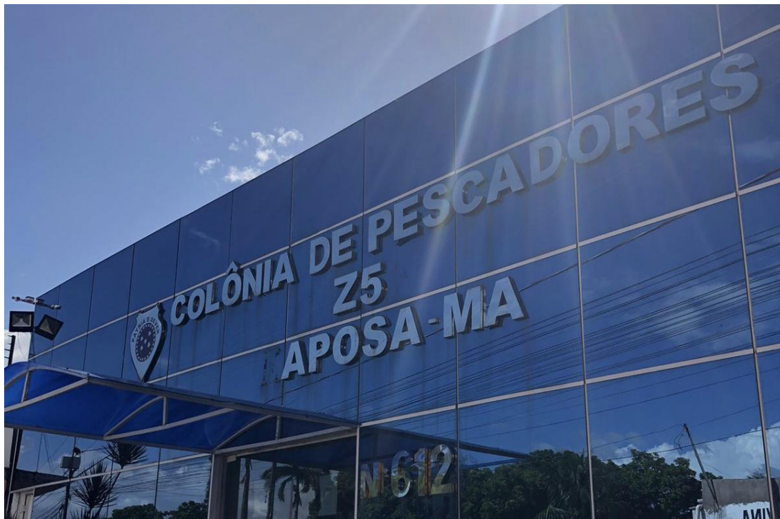
Figura 3 — Colônia dos Pescadores; sede responsável por reivindicar os direitos dos pescadores da Raposa.

seguro. Contudo, durante a pesquisa de campo no Cais da Raposa, foi-se descoberto que muitos dos pescadores locais não recebem essa quantia e mesmo os que recebem alertam que ela não é suficiente para se manter financeiramente de maneira digna sem a captura do camarão. De acordo com dados do relatório de 2017 do Ministério da Transparência e Controladoria-Geral da União (CGU) sobre a regularidade dos pagamentos do seguro defeso ao pescador artesanal, no Maranhão, cerca de 78,23% dos pescadores receberam o seguro defeso de forma indevida 31 e, no município da Raposa, esse número chegou aos 75% 32 .