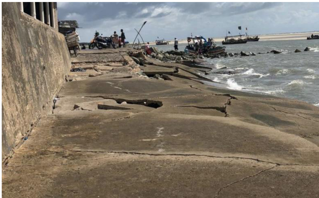
Figura 4 – Caminho para o cais destruído pela maré.