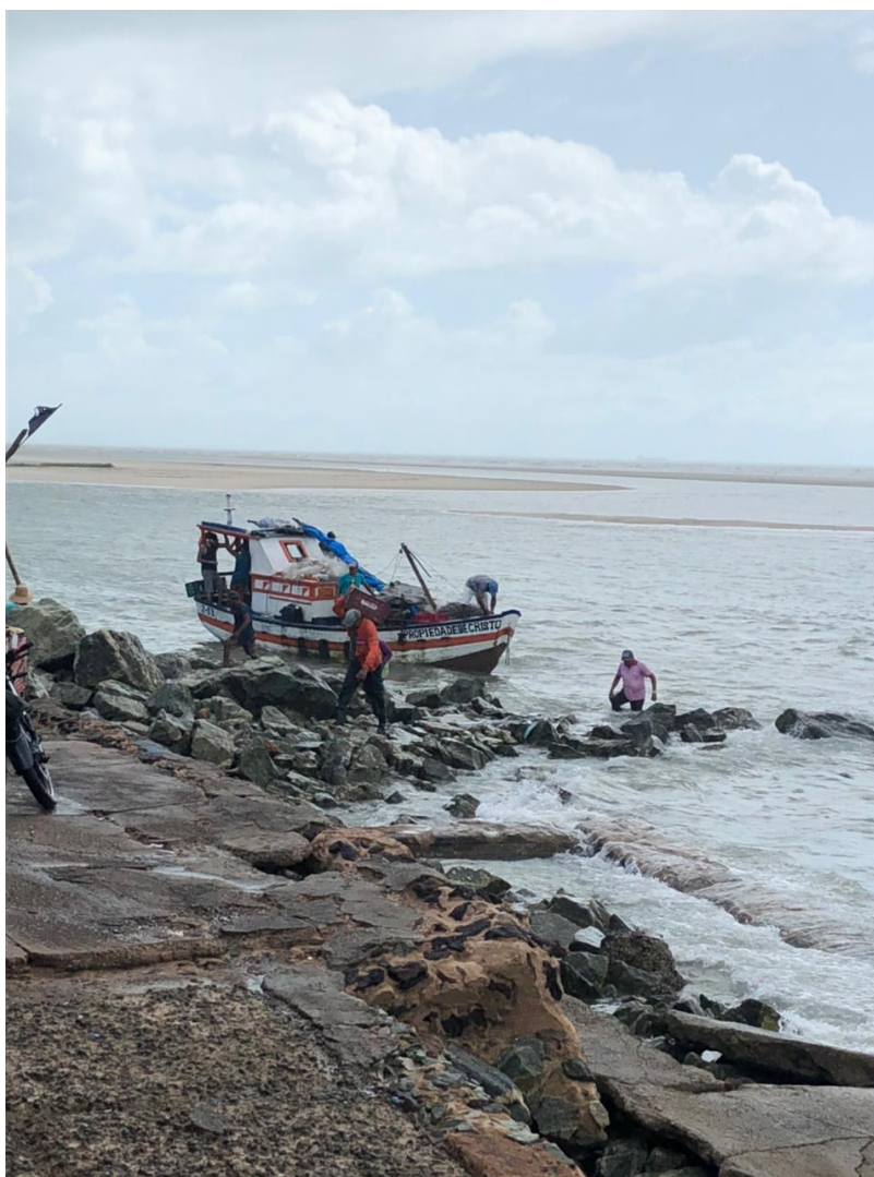
Figura 2 — Barco Artesanal utilizado para pesca.