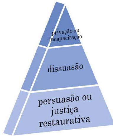
Figura 4 – Pirâmide de finalidades regulatórias ou da teleologia das medidas de constrangimento.