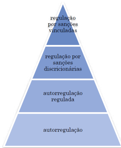
Figura 1 – Pirâmide de Estratégias Regulatórias

Tendo em conta que o presente artigo não possui a pretensão de aprofundar todos os aspectos da regulação responsiva, mas apenas aqueles que possuam maior possibilidade de aplicação intercambiada com o processo estrutural, iremos mencionar aqui apenas quatro das pirâmides regulatórias concebidas por Ayres e Braithwaite: a pirâmide de estratégias regulatórias, a pirâmide de enforcement ou das medidas de constrangimento, a pirâmide de perfis de regulados e a pirâmide das finalidades regulatórias ou da teleologia das medidas de constrangimento, abaixo reproduzidas.