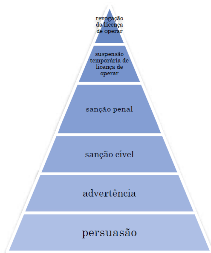
Figura 2 – Pirâmide de Enforcement ou das medidas de constrangimento.