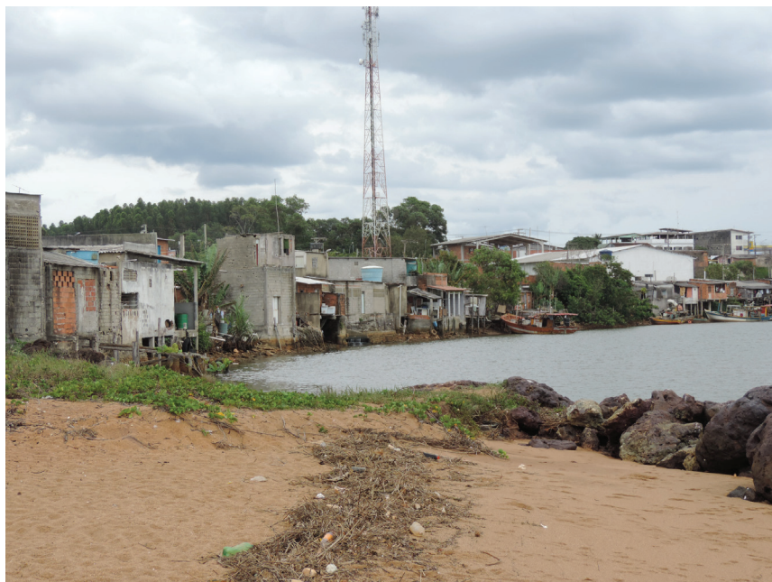
Imagem 2 – Vila de pescadores em Barra do Riacho (ES)