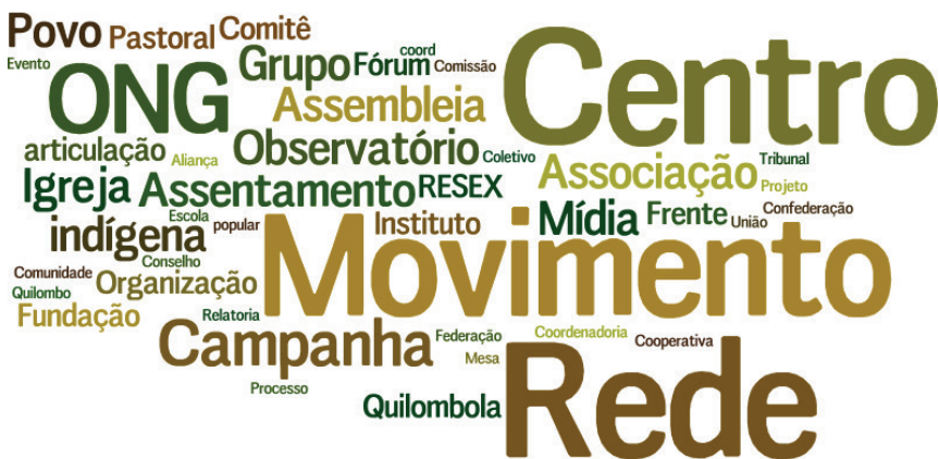
Imagem 1 – Tipos de mobilização