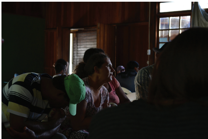
Imagem 3 – Oficina realizada em Regência