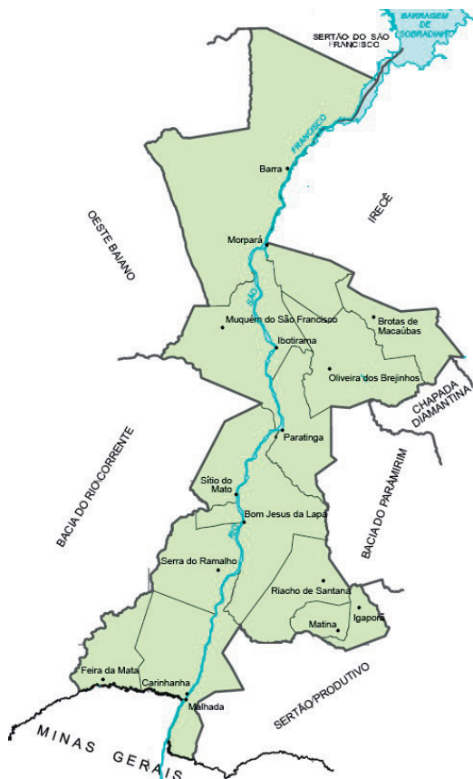
Figura 1 – Território de Identidade do Velho Chico, Bahia.

Brotas de Macaúbas, Feira da Mata, Morpará e Serra do Ramalho apresentaram redução no número de habitantes de 2000 a 2010, por causa, entre outros fatores, do êxodo rural, devido sobretudo à busca de melhores condições de vida.