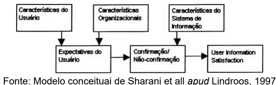
Fig. 2: Satisfação Informacional do Usuário

Outra forma de abordagem é a denominada “satisfação informacional do usuário” ( user information satisfaction ). Um dos modelos utilizados, baseado em pesquisas sobre satisfação dos consumidores, é o modelo desenvolvido por Kim apud Lindroos (1997). O modelo é baseado na teoria geral de sistemas e considera as expectativas do usuário como fator chave para a determinação da satisfação. As principais críticas a esse modelo repousam na atenção dada ao produto, em detrimento das características pessoais do usuário e do contexto organizacional em que o sistema se insere. Em Sharani et al apud Lindroos, 1997, encontra-se um modelo onde as características do usuário, juntamente com as da organização, formam as expectativas do usuário, que em oposição aos resultados fornecidos pelo sistema, confirmam ou não estas expectativas, gerando satisfação ou insatisfação. Ambos são apresentados a seguir, nas figuras 2 e 3.