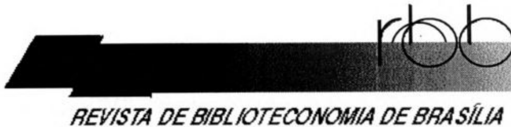
Figura 2 - Marca definida para o protótipo

O símbolo visual é formado por uma faixa que se estende, de maneira ondulada, sob a sigla da RBB. O objetivo é dar um efeito leve ao banner que tem a cor da biblioteconomia, um lilás em dégradé . A tipologia usada no símbolo verbal na sigla é uma adaptação da fonte AVANTGARDE . Para o nome da revista optou-se por FRANKLIN GOTHIC ITALIC . Tendo em vista as especificidades da revista e sua missão, considera-se importante uma apresentação discreta dos elementos gráficos e uma estrutura simples, que considere o texto como o principal recurso informacional. Atendendo às necessidades dos pesquisadores e às possibilidades atuais da revista o protótipo não utiliza recursos multimídia.