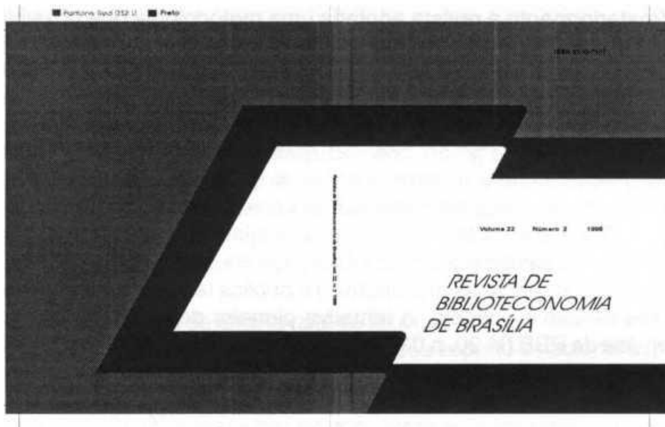
Figura 1 - modelo de capa para revista impressa

A construção do site considerou seções específicas, o trabalho acontece de maneira simbiótica, ou seja, observando as características do formato anterior.