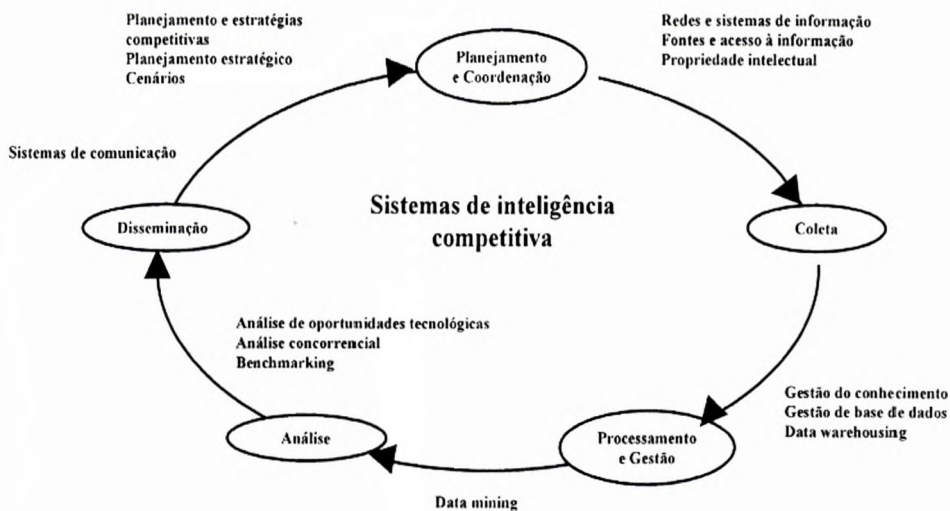
Fig. 3 – Conteúdo programático do CEIC