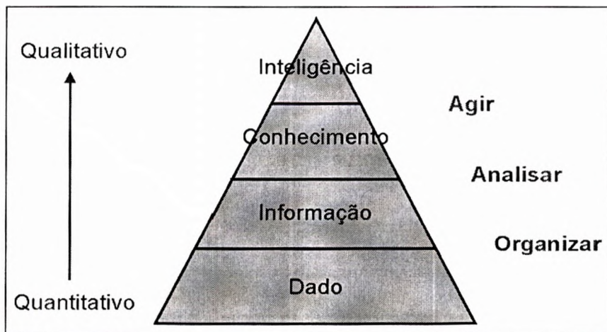
Fig. 1 – Modelo de inteligência competitiva

O modelo da inteligência competitiva, segundo Jéquier & Dedijer (1987), está representado na figura, a seguir, e vai do dado -considerado como matéria-prima bruta, dispersa -, passa pela informação - onde se pressupõe a existência de uma estrutura organizada -, pelo conhecimento e chega até a inteligência - onde a análise fornece ao tomador de decisão elementos para ação.