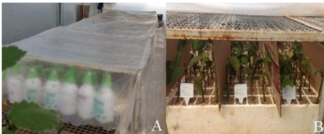
Figura 1. Disposição do desenho experimental das estacas caulinares de amoreiras-brancas em casa de vegetação. A: Cobertura para manutenção da umidade; B: Separação dos tratamentos.

enraizamento; número de folhas; comprimento e massa da matéria seca de brotações; comprimento da maior raiz e área e volumes radiculares. Essas duas últimas variáveis foram determinadas utilizando-se o software WinRhizo(R).