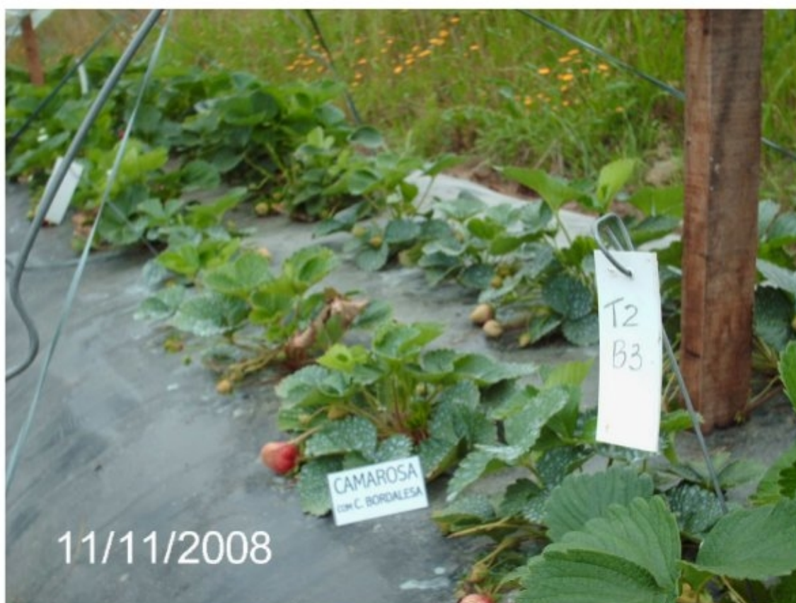
Figura 2: Enfezamento das plantas da cultivar Camarosa devido à aplicação semanal de calda bordalesa (0,5%). Embrapa Clima Temperado, Pelotas, 2008.

A produção de morangos esteve distribuída entre os meses de setembro a dezembro, para a cultivar Camarosa e setembro a fevereiro para a cultivar Albion, com maior concentração nos meses de outubro e novembro, para ambas as cultivares, independentemente das caldas utilizadas. A produção de pseudofrutos por planta acumulada em cada mês de colheita não diferiu estatisticamente entre os tratamentos para as diferentes cultivares estudadas, por isso as cultivares foram apresentadas em um único