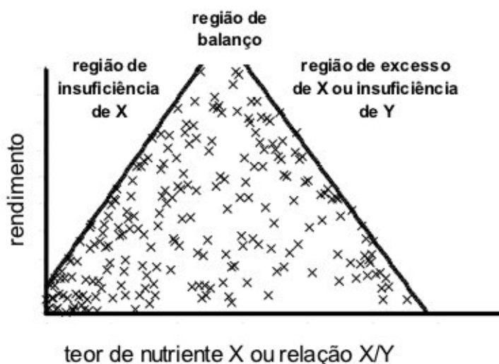
Figura 1: Esquema gráfico para determinação das regiões de insuficiência, balanço e excesso de um nutriente x, ou de insuficiência de Y na relação X/Y (Adaptado de SUMMER & FARINA, 1986).

Com base no método proposto por Summer & Farina (1986), densidade de plantio, comprimento das estacas e profundidade de solo tiveram seus valores pontuais diagramados contra os respectivos valores de produtividade do vime. Para facilitar a identificação das regiões de insuficiência, balanço e excesso, foram geradas duas retas de regressão, uma à esquerda e outra à direita do conjunto de dados (Figura 1). A reta à esquerda – reta ascendente – foi gerada a partir do valor mais à esquerda no gráfico de produtividade e o valor imediatamente à direita e acima deste. Os valores acima e à direita desse segmento de reta foram progressivamente adicionados ou removidos da equação, de forma a se obter a regressão com o coeficiente de