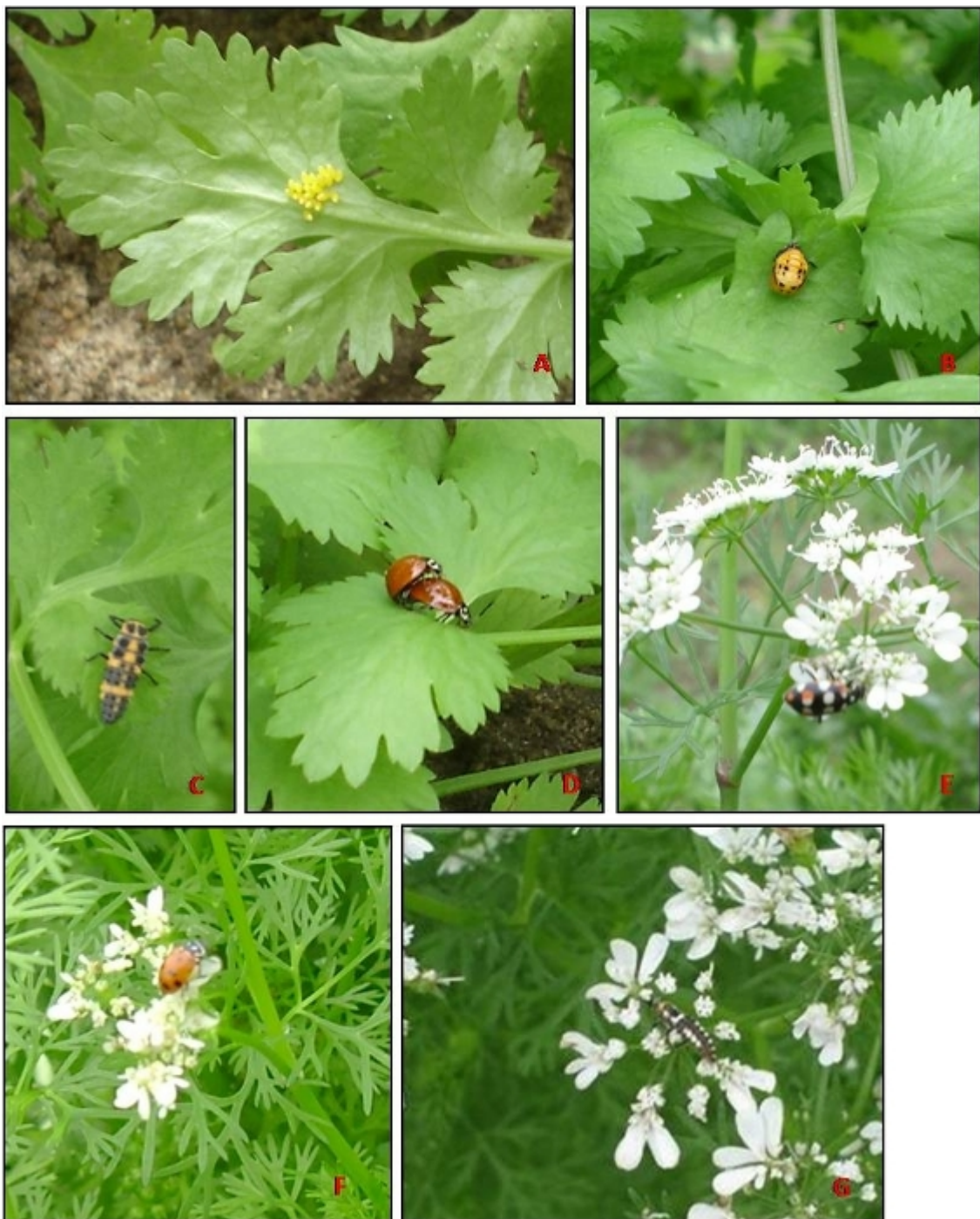
Figura 2. Diferentes estádios de desenvolvimento das joaninhas utilizando recursos do coentro, na Fazendinha Agroecológica Km 47, Seropédica/RJ.

De acordo com Resende et al. (2006), essas três espécies são predadoras do pulgão da couve, Lipaphis pseudobrassicae Davis, em condições de campo. Mendes et al. (2000) encontraram resultado semelhante em levantamento de predadores de pulgões realizado na cultura da