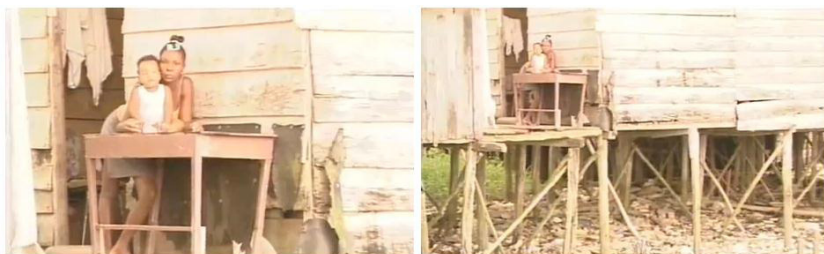
IMAGEN 3. Papel del Zoom en la construcción de sentido