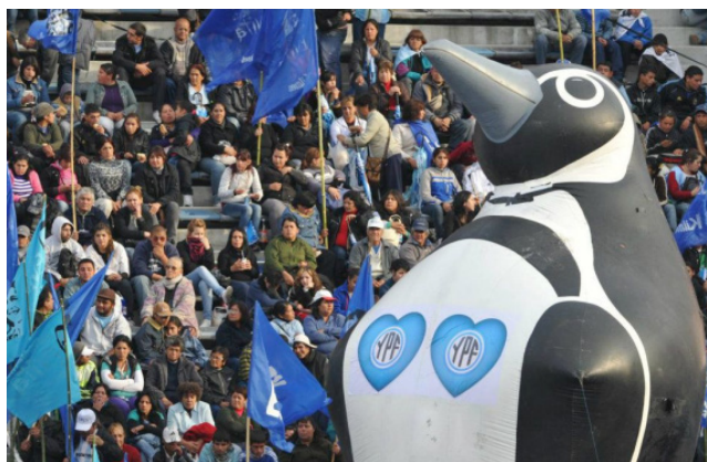
Imagen del acto de Vélez publicada en el muro del Gobernador de Entre Ríos, S.Urribarri.

Si en todos los casos se reiteran imágenes de la multitud abigarrada, banderas y estandartes en los que predominan los colores patrios y representaciones diversas de Néstor y Cristina Kirchner, la foto presentada, además de compartir estos rasgos, tiene un trabajo retórico más interesante. La