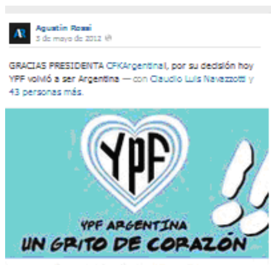
Imagen publicada en el muro del Diputado A. Rossi.

En este caso, el diputado recurre a la ilustración y a la simbología y se desmarca del realismo fotográfico. La afectividad representada, una vez más, a través de la puntuación expresiva, el juego gráfico con el logo de la empresa y el emblema del corazón-escarapela, el nacionalismo marcado por los colores patrios, la evocación de la militancia popular en la tipografía que imita el graffiti y la paráfrasis de un fragmento emblemático del estribillo de la marcha partida en la que se sustituye el nombre del fundador del partido por el de la petrolera. Una vez aprobada la norma en general 17 ,