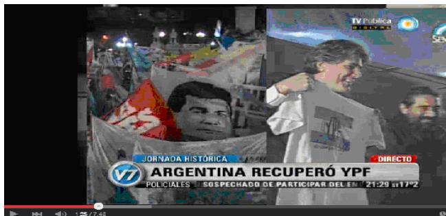
Imagen publicada en el muro del Vicepresidente A. Boudou.

Los dos fotogramas inscriben el evento del día en series políticas, ideológicas, históricas y regionales asimilables a la matriz del discurso oficialista y, por lo tanto, inmediatamente reconocibles para los prodestinatarios.