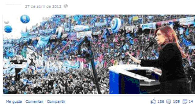
Imagen publicada en el muro del Senador Abal Medina.