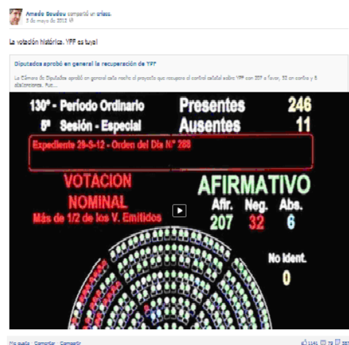
Imagen publicada en el muro del Vicepresidente A. Boudou.

La representación de la presencia popular invita a recuperar algunas de las ideas planteadas por Bajtin para analizar la cultura carnavalesca medieval: barras y banderas “carnavalizan” el recinto, construyen un híbrido que, hasta cierto punto, postula “la abolición provisoria de las diferencias y barreras jerárquicas entre las personas y la eliminación de ciertas reglas y tabúes vigentes en la vida cotidiana” (Bajtin 1987: 16). Hasta cierto punto, subrayo, porque el carácter utópico de tal abolición y la estricta distribución de roles está marcado también por las indumentarias que distinguen a unos y otros, la capacidad de usar o no la palabra, etc. Los representantes debaten en las bancas, los representados aplauden en las bandejas. Sólo así el espectáculo de la representación democrática puede celebrarse a sí mismo.