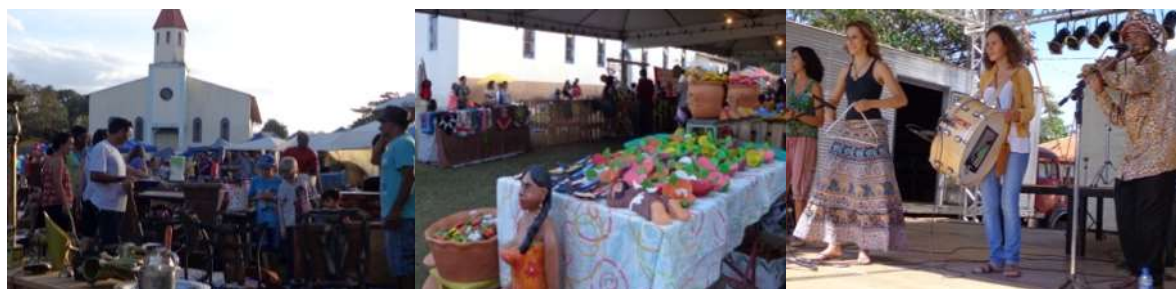
Figura 4. Feira do Troca em Olhos d'Água.

Legenda: da esquerda para a direita: exposição de produtos destinados à troca; artesanatos em cerâmica; e. apresentação cultural.