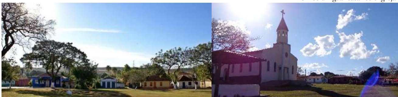
Figura. 3 – Vista da área central de Olhos d'Água: casarios e igreja.

Goiânia, Abadiânia, Anápolis, Cocalzinho de Goiás, Corumbá de Goiás, Santo Antônio do Descoberto, Pirenópolis, Águas Lindas e Valparaíso.