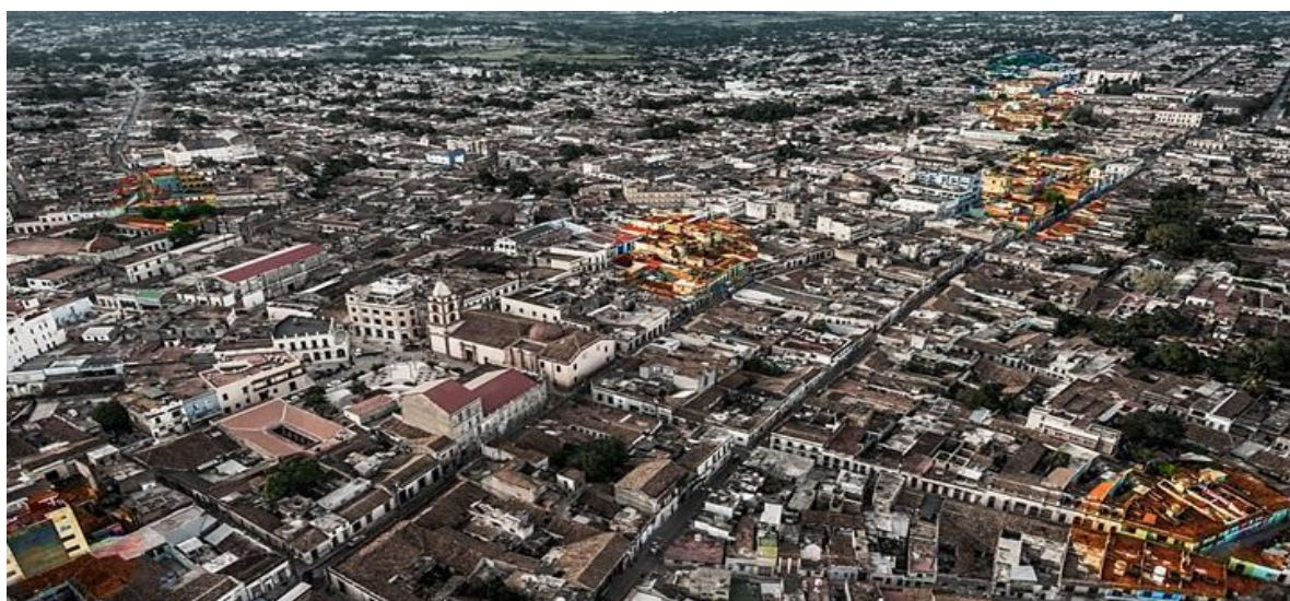
Figura 2. Vista aérea de la ciudad de Camagüey