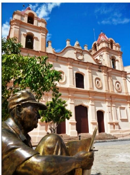
Figuras 3 y 4. Plaza del Carmen, Camagüey (Izquierda). Casa del altillo en la Plaza de San Juan de Dios, Camagüey

La construcción simbólica de la ciudad permite considerar en una primera Etapa de Formación (1528-1692) una estructura que respondió a las condiciones del medio físico, a las relaciones funcionales principales y a los intereses de las clases con recursos económicos. Ello originó la regularidad y simplicidad del espacio principal convertido en centro de poder y la “arbitrariedad” en el resto de la trama al alejarse de dicho núcleo que, tanto a nivel urbano como arquitectónico, fue consecuencia espacial y formalmente del repertorio habitacional. Esto se manifestó a nivel urbano, por la falta de normativas en la concesión de solares para particulares dando como resultado la irregularidad de los lotes y manzanas y a nivel arquitectónico, por la expresión formal de las viviendas de los vecinos principales quienes expresaron en ellas su poderío económico.