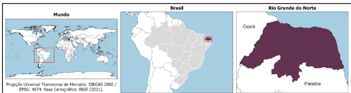
Figura 1 – Mapa de localização do Rio Grande do Norte

Nesse contexto, o Estado era o agente viabilizador do desenvolvimento regional e sua intervenção baseava-se em algumas orientações, como a prioridade de investimentos para o setor industrial e a criação de formas de compensação para as regiões mais desiguais. Somam-se a isso os investimentos em infraestrutura básica como transporte, energia e comunicações, para integrar o território nacional e atender, também, aos interesses das empresas. Essas orientações foram influenciadas pela concepção keynesiana de Estado e pelo nacional-desenvolvimentismo, que direcionaram a política regional e urbana brasileira (Diniz & Crocco, 2006), e que posteriormente alcançaram o Rio Grande do Norte (RN) (figura 1).