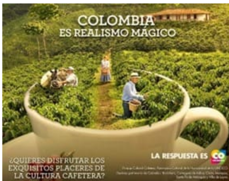
Figura 4 – Imagen publicitaria, marca país “Colombia es Realismo Mágico”

Disponible en: https://www.cronicadelquindio.com/noticias/economia/turismo-experiencial-apuesta-para-el-paisaje-cultural-cafetero