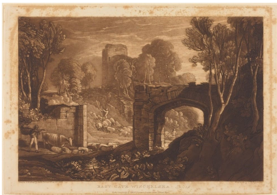
Figura 3 – J.M.W. Turner y Samuel William Reynolds East Gate, Winchelsea, exhibida en 1819

Disponible en: https://www.nga.gov/collection/art-object-page.10691.html