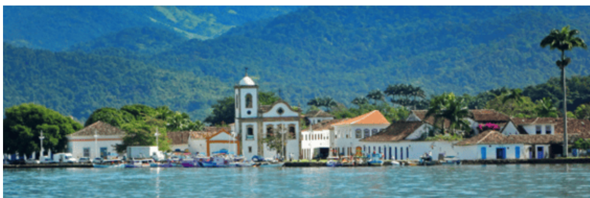
Figura 5 - Ciudad de Paraty e Isla Grande, sitio en la Lista del Patrimonio Mundial

Disponible en: http://portal.iphan.gov.br/noticias/detalhes/5164/paraty-e-ilha-grande-rj-ganham-titulo-de-patrimonio-mundial-da-unesco