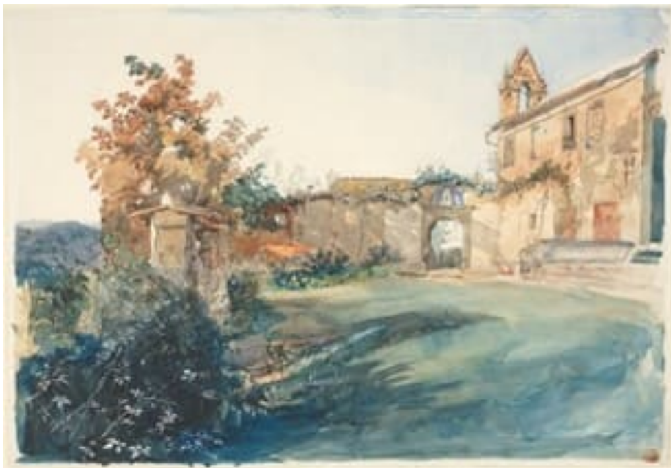
Figura 2 – John Ruskin, 1845, El Jardín de San Minato, cerca de Florencia

Disponible en: https://www.nga.gov/Collection/art-object-page.72870.html