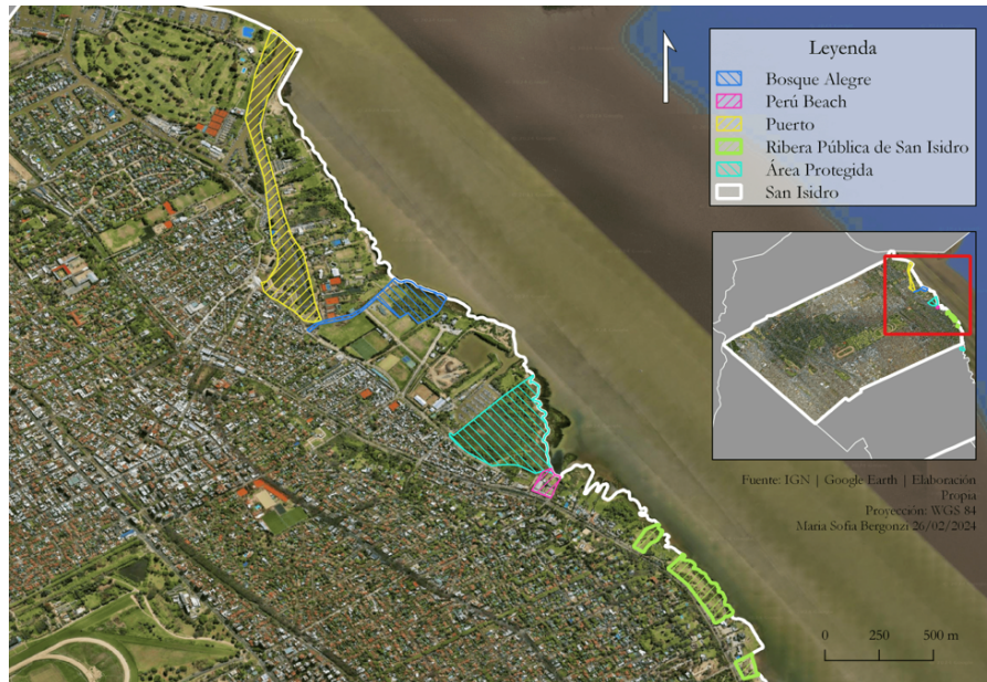
Figura 5 – Áreas populares de la Ribera de San Isidro: el Bosque Alegre, el Puerto, el Parque Natural Municipal Ribera Norte y Perú Beach