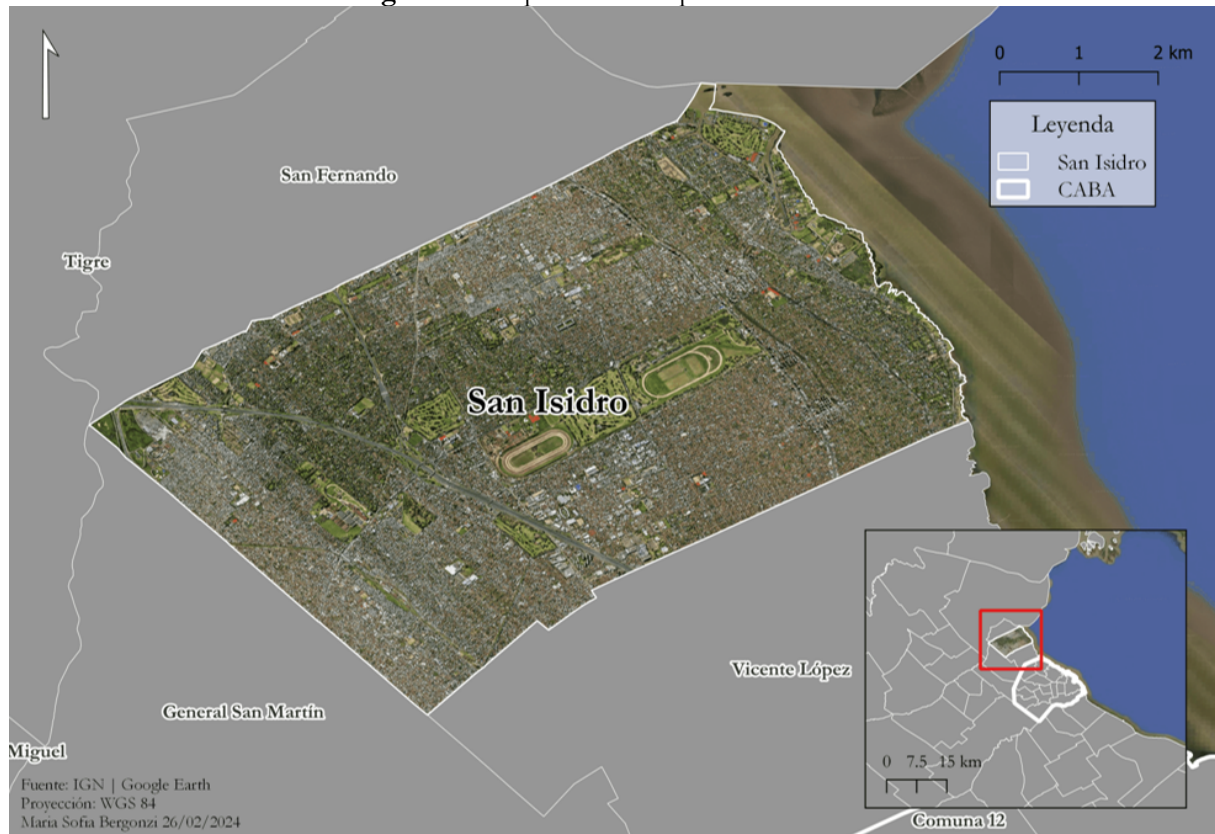
Figura 2 – Mapa del Municipio de San Isidro