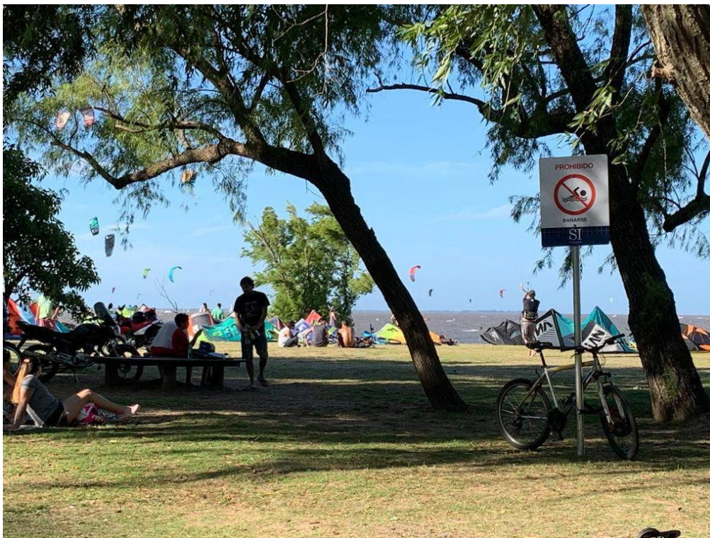
Figura 4 – Anuncio municipal prohibiendo el consumo de bebidas alcohólicas, bancos, usuarios, motocicletas y barriletes correspondientes al deporte acuático kitesurf

está mucho más ordenado, mucho menos peligroso, con bajas arriba, mucho más accesibles, por si alguien quiere entrar al río. Eso es un buen cambio, después se han visto que han plantado árboles, hay más árboles que antes, jóvenes todavía, pero más árboles que antes, después, bueno, hablábamos de la luz, ¿no?, que se pusieron luz, pero nunca la prendieron por suerte, y... por suerte ese río se mantiene muy natural, a diferencia de los costados que te comentaba que son están aledaños, pero no se consideran el mismo río(...). La gente no era de usar ese lugar tanto para hacer eso, se veía gente bajar desde las bajadas públicas, pero después el resto de las prácticas se ve que se mantiene en el tiempo, gente a la mañana haciendo deportes, los días de semana, como correr, bicicleta, yoga y a las tardes, y los fines de semana, mucha gente reunión social, ¿no? un espacio de esparcimiento para charlar, y eso se ve que con los años no ha cambiado, (...). (Pedro Lamote, carpintero, 26 años)