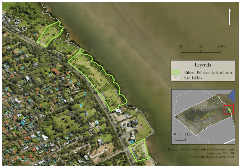
Figura 3 – Ubicación de la Ribera pública del bajo de San Isidro