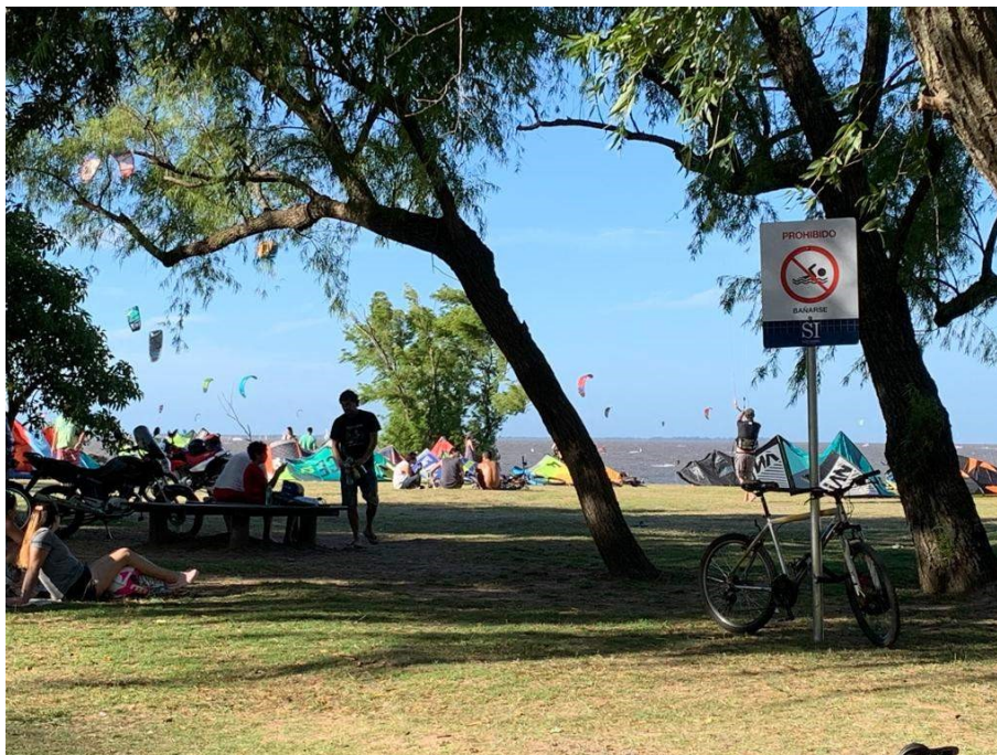
Figura 6 – Actividades deportivas, tiempo libre compartido en grupo al aire libre