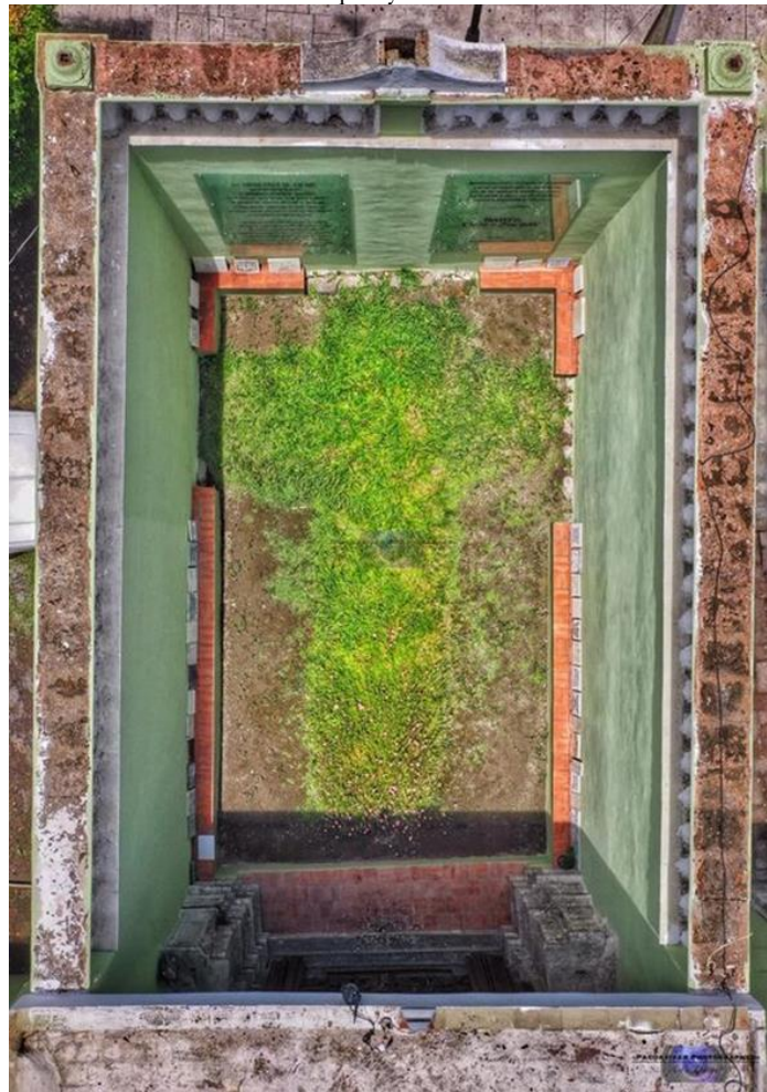
Figura 3 – Panorámica del Templo y el exConvento de la Cruz de Zacate