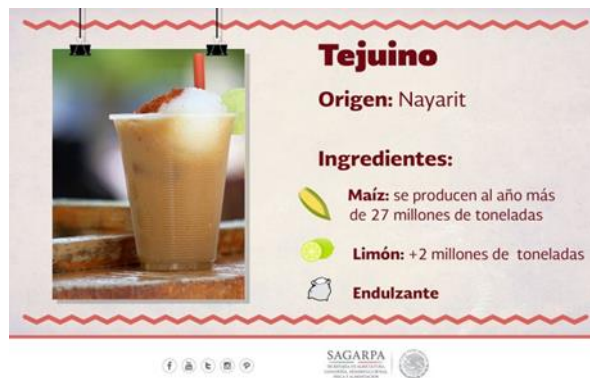
Figura 6 – Tejuino