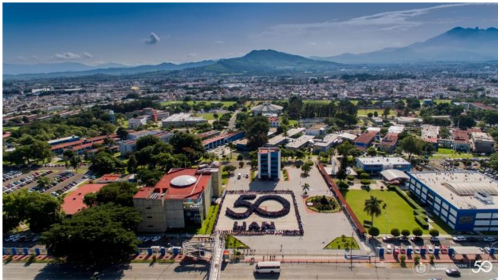
Figura 8 – Panorámica de la Universidad Autónoma de Nayarit

Fuente: Fotografía de Oscar Verdín, agosto de 2019.