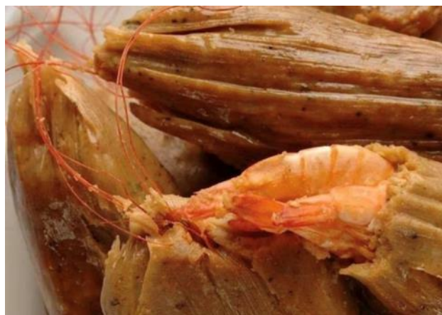
Figura 7 – Tamales de camarón o barbudos