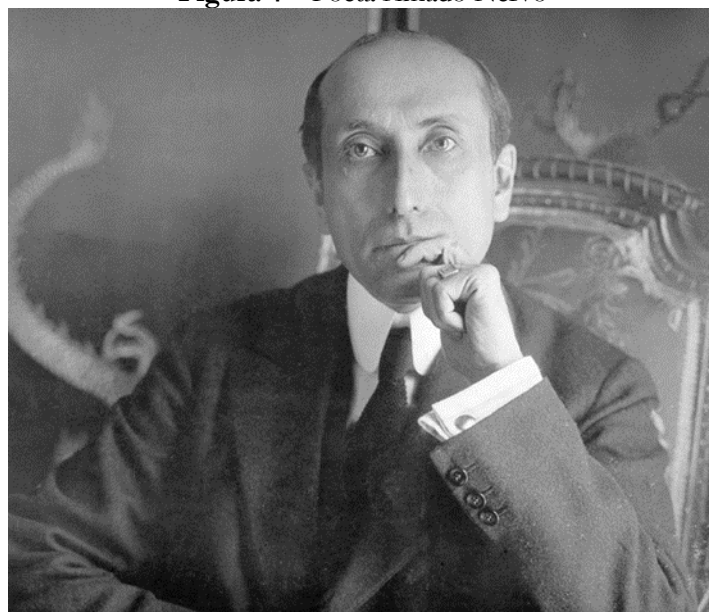
Figura 4 – Poeta Amado Nervo