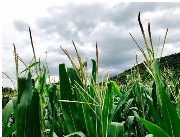
Figura 5 – Sembradíos de maíz