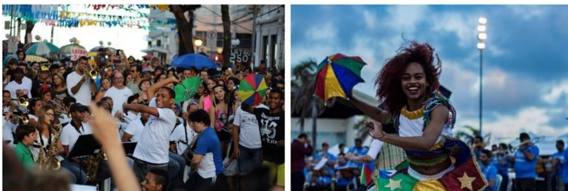
Figura 4 – Orquesta, “passistas” y populares en los ensayos para el carnaval de Recife

Almeida (2014) a partir de relatos del comité directivo para la salvaguardia del frevo (instituido en el 2011 y compuesto por representantes de diversos segmentos directamente responsables por su reproducción, promoción y valorización) presenta algunos de los embates existentes entre los sujetos-patrimonio del frevo. Este libro expone cuestiones que dividen posiciones y opiniones a investigadores(as), compositores(as), músicos, bailarines, a la prensa y a la comunidad del frevo en general, tales como: alteraciones, fusiones e incorporaciones de ritmos e instrumentos a las orquestas, modificaciones de pasos o vestuarios, discusiones acerca de los temas de las letras, del apoyo público y privado, etc. Tratando específicamente de la música, Teles (2008) expone argumentos y episodios que explican el arduo camino del frevo (rodeado de intereses ideológicos, económicos y socioculturales) y pone de relieve los choques internos y externos que, reforzados por el nacionalismo, insisten en clasificarle como ‘música regional’. Considerarlo música/ritmo/genero de carnaval es muy común para justificar su limitación y existencia casi que exclusiva a este período. Este intento de etiquetar al frevo es objeto de estudios y publicaciones que no trataremos aquí, sin embargo, es un aspecto que tiene/puede tener repercusiones en el uso turístico del frevo y por esta razón lo profundizaremos futuramente.