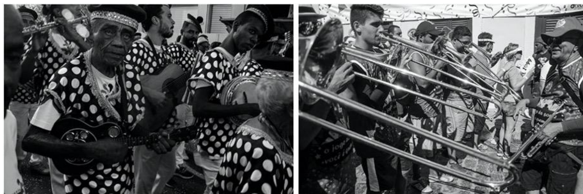
Fotos: Marcelo Soares (2016). Fuente: Santos, Mendes & Resende (2019).