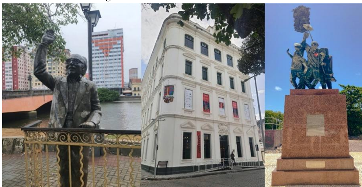
Figura 5 - La materialización del frevo en Recife

Identificar la territorialización del frevo y sus peculiaridades es imprescindible para esta investigación y lo haremos con más profundidad desde la escucha y observación a los 'sujetos-patrimonio' y no exclusivamente desde lo que propone y realiza el poder público, las instituciones patrimoniales o el mercado. Es ese, por lo tanto, el camino metodológico futuro de esta investigación. A partir del contacto y de las entrevistas con la comunidad del frevo buscaremos ampliar la comprensión acerca de cómo se materializa y espacializa el frevo en Recife para entonces identificar otras posibilidades para su uso turístico.