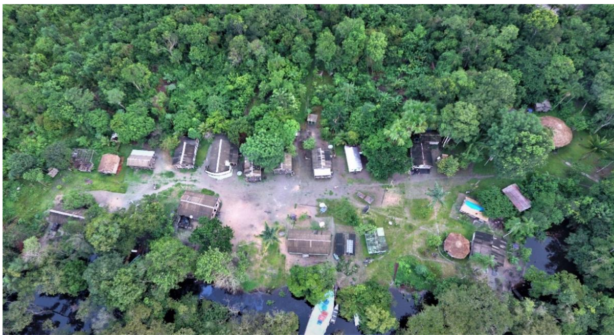
Figura 02 – Vista área da comunidade de Xixuaú