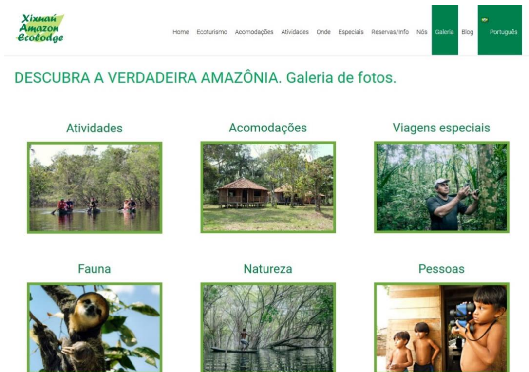
Figura 05 – Página de publicidade na internet do turismo em Xixuaú