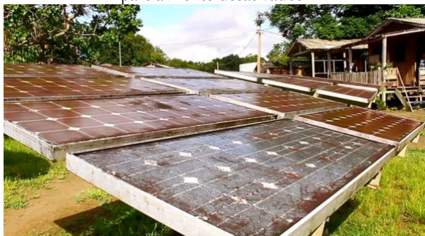
Figura 03 – Painéis de energia solar em Xixuaú parcialmente desativados