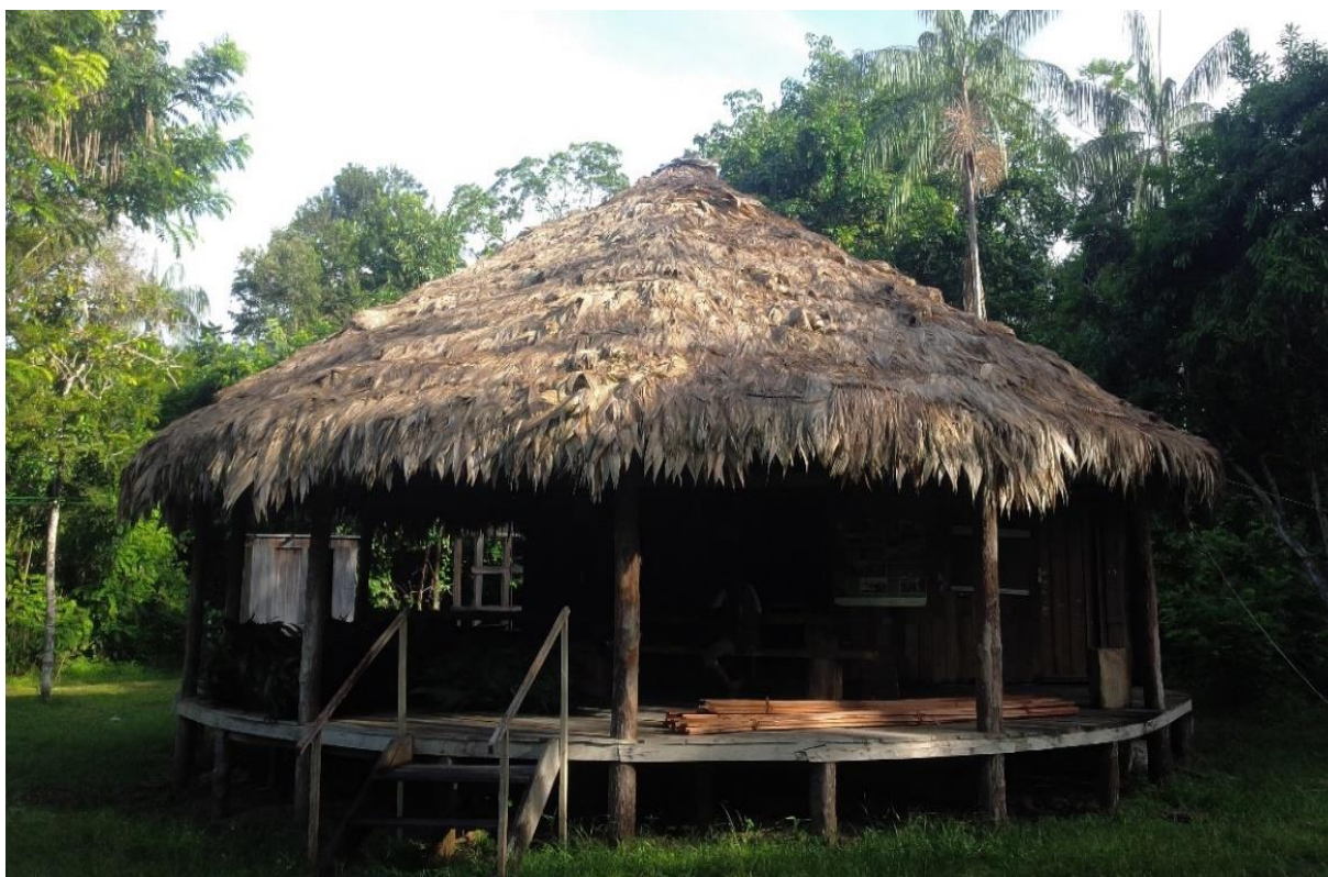
Figura 04 – Malocção da CoopXixuaú onde se desenvolvem ações de turismo

Fonte: Trabalho de campo de Roberto Caleffi (maio/2019).