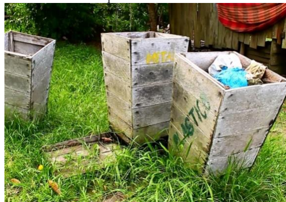
Figura 06 – Mesmo com recipientes para coleta seletiva, ainda há queima de resíduos na vila