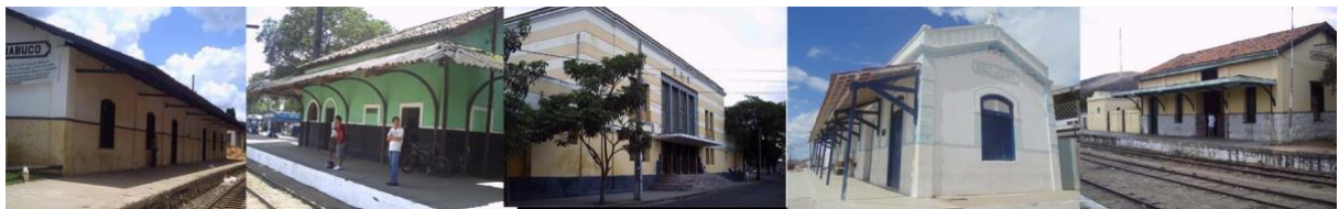
Figura 3 – Estações ferroviárias de Joaquim Nabuco, Carpina, Caruaru, São João e Arcoverde em Pernambuco