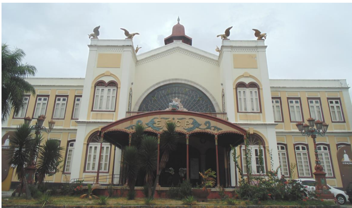
Figura 6 – Estação Central do Recife, sede do Museu do Trem

Em Pernambuco, a partir da pesquisa de campo, foi possível identificar alguns usos mais comuns atribuídos aos edifícios das antigas estações, havendo uma grande incidência de usos ligados ao patrimônio cultural, em outras palavras, usos com a finalidade de difusão do próprio patrimônio cultural: centros culturais, museus, memoriais, centros de artesanato. Nesse sentido, é perceptível a tendência de criação de museus. Uma interpretação desse fato pode ser a rápida associação entre uma edificação antiga, que não mais cumpre com sua função original, ao que deve ser destinada a uma função de dar corpo a memórias coletivas. Seria talvez isso um reflexo da necessidade de memória colocada por Le Goff (2013), quando a coloca como “um elemento essencial do que se costuma chamar de identidade,