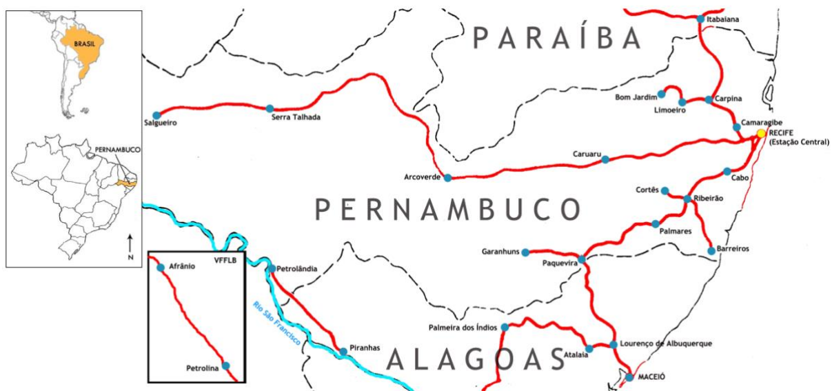
Figura 1 – Mapa das ferrovias de Pernambuco