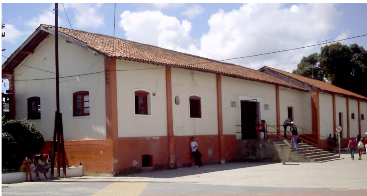
Figura 4 – Estação ferroviária do Cabo de Santo Agostinho, Região Metropolitana do Recife

Em nível estadual, a Fundarpe abriu o processo de tombamento temático do patrimônio ferroviário no ano de 2001, sendo ampliado em 2006 com o segundo edital, que passou a abranger todo o patrimônio ferroviário de Pernambuco, em sua diversidade de elementos (Fundarpe, 2014). Os órgãos citados têm, dentre outras, a função de deliberação e orientação na salvaguarda deste patrimônio, tomando como referência a orientação