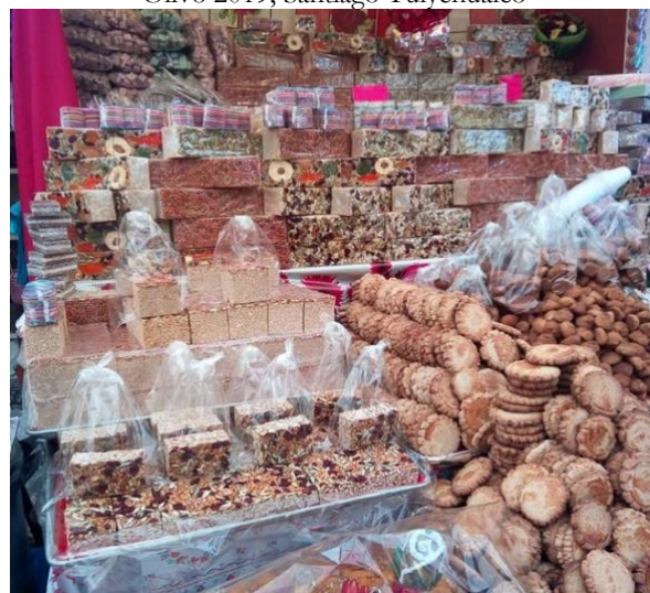
Figura 3 – Un puesto en la Feria del Amaranto y el Olivo 2019, Santiago Tulyehualco

La metodología desarrollada, de carácter cualitativo, consistió en trabajo de gabinete para delimitar los conceptos y corrientes geográficas utilizadas y el diseño para el trabajo de campo, que consistió en cinco entrevistas a profundidad aplicadas a habitantes de Santiago Tulyehualco dedicados al cultivo de amaranto, elaboración y/o comercialización de productos derivados del mismo. El instrumento metodológico se empleó en dos momentos, entre febrero y junio de 2019: A. Durante la Feria del Amaranto y el Olivo, uno de los eventos más icónicos para la localidad, de gran importancia cultural y económica (figura 3); B. Posteriormente con nuevas fuentes contactadas a partir de la técnica de investigación de bola de nieve (iniciada en el evento ya mencionado).