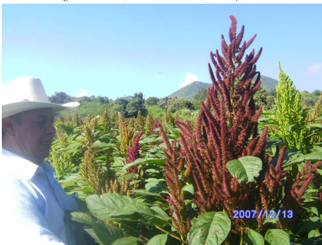
Figura 4 – Amaranto, cultivo de subsistencia, existencia y resistencia

Fuente: Acervo de la familia Franco Xolalpa (2007). Planta de amaranto.