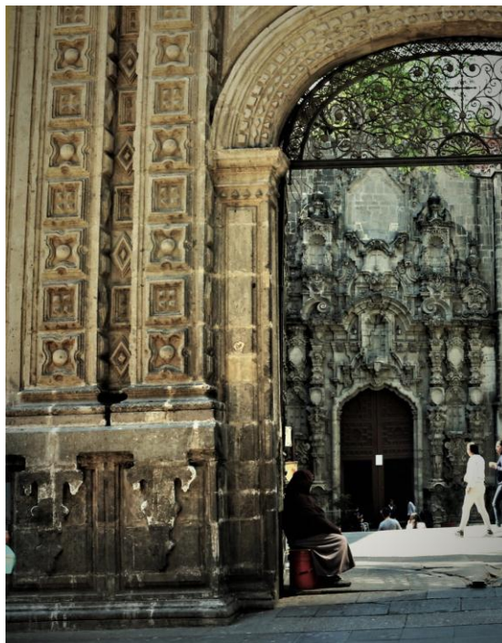
Foto 01 - Propuesta para el logo-marca. Doctoranda Rúbia de Paula Rúbio. Integrante de Gecipa/CNPq.

Esas referencias a la fotografía son para justificar el logo-marca de PatryTer, que dialoga - estética y filosóficamente - con el diseño indígena contenido en la portada barroca, síntesis de la acumulación y la sobreposición espacio-temporal constituyente de la civilización latinoamericana.