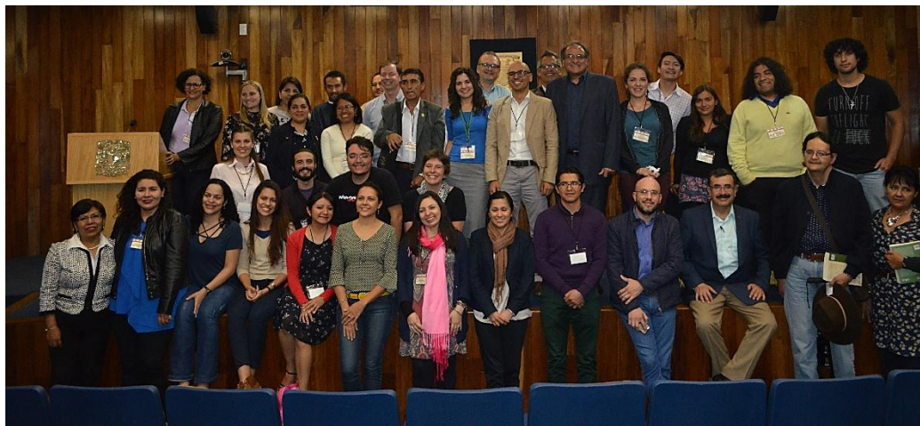
Foto 03 – Organizadores y algunos participantes del I CLUP – UNAM-México.

Como es mencionado en el primer ítem de este texto, el cual registra el proyecto político de PatryTer, la propuesta fue divulgada y avalada (antes de ser creada la Revista) en diversas universidades latinoamericanas y caribeñas, por ocasión del trabajo de campo del proyecto de investigación Riesgos y preservación patrimonial en América Latina y el Caribe . Además, fue durante el I Coloquio Latinoamericano sobre Urbanización y Patrimonialización (marzo de 2017 / México) que la utopía ganó potencia para la concretización o para la realización efectiva (foto 3).