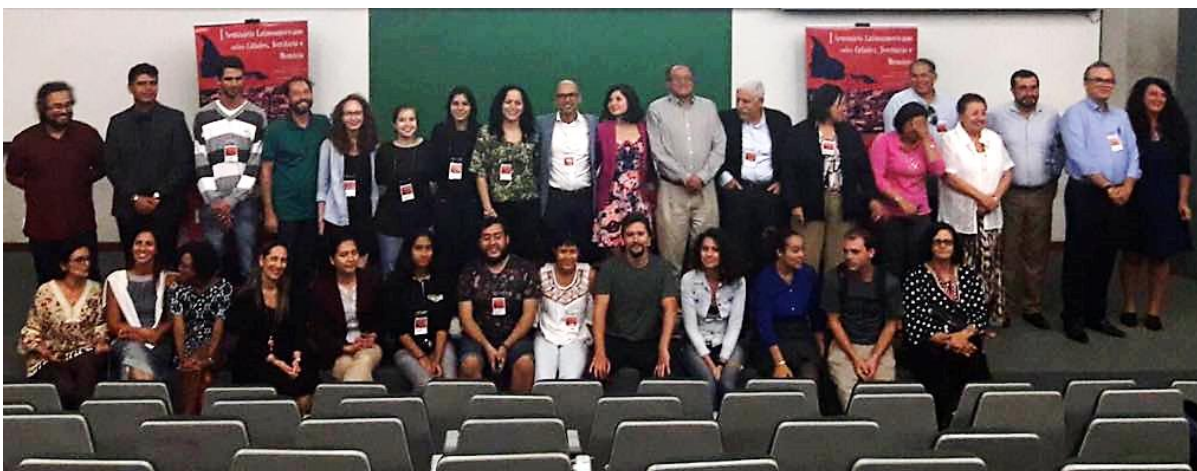
Foto 02 – Lanzamiento de PatryTer – Revista Latinoamericana y Caribeña de Geografía y Humanidades, durante el I Seminario Latinoamericano sobre Ciudades, Territorio y Memoria / UnB, Brasilia.

Finalmente, en marzo de 2018, fue lanzado el vol. 1 n° 1 de la Revista, con artículos de colegas de México, Cuba, Brasil, Costa Rica y Ecuador. Esperamos seguir con este importante intercambio continental. Parte de los autores de este número estuvieron presentes en el lanzamiento de PatryTer, el cual ocurrió durante el I Seminario Latinoamericano sobre Ciudades, Territorio y Memoria, organizado por GECIPA, en la Universidad de Brasilia (foto 02).