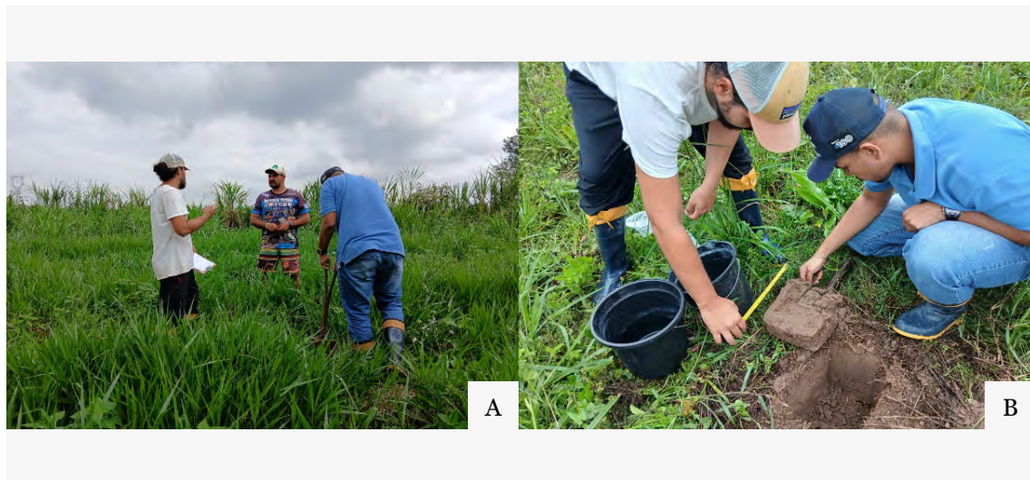
Figura 2 — (A) Coleta de solo na horta de estudo Itaipu meridional, em Nova Santa Rita e (B) na horta de estudos Integração Gaúcha, em Eldorado do Sul. 2025.