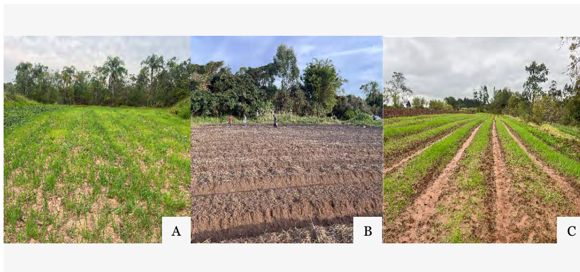
Figura 1 — (A) Horta de estudos Filhos de Sepé, em Viamão; (B) Horta Integração Gaúcha em Eldorado do Sul e (C) Horta de estudos Itapuí Meridional, em Nova Santa Rita. 2025.