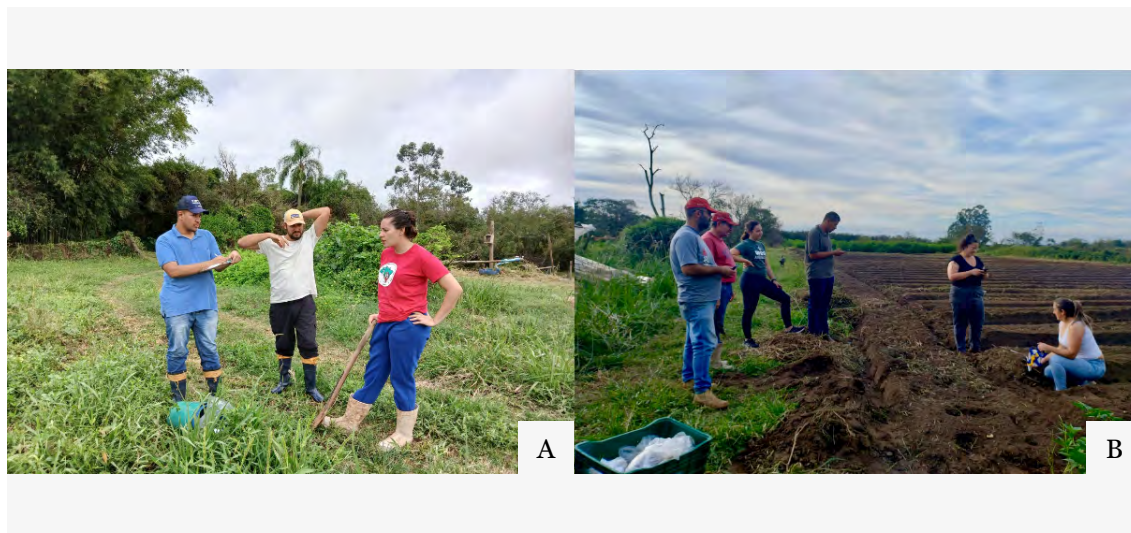
Figura 5 — Alunos de graduação e pós-graduação conduzindo atividades extensionistas junto aos agricultores (A) coleta de solo; (B) Semeadura de plantas de cobertura na horta de estudo Integração Gaúcha. Eldorado do Sul, 2025.