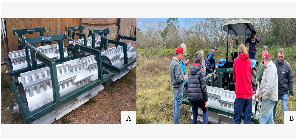
Figura 3 — (A) Equipamentos do tipo rolo-faca adquiridos para a realização do manejo das plantas de cobertura. (B) Teste do equipamento com os agricultores. Eldorado do Sul, 2025.