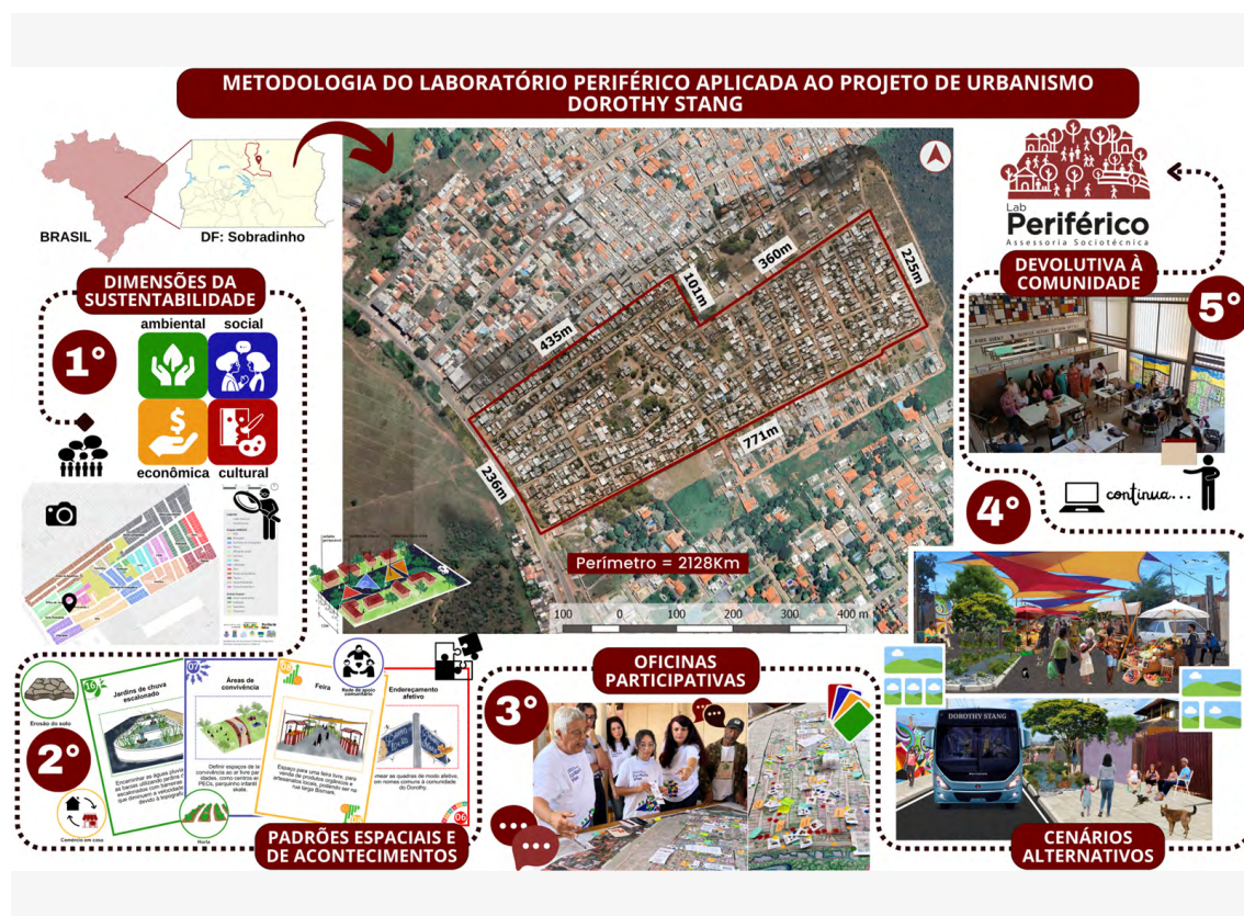
Figura 3 — Metodologia do Laboratório Periférico aplicada ao projeto de urbanismo Dorothy Stang