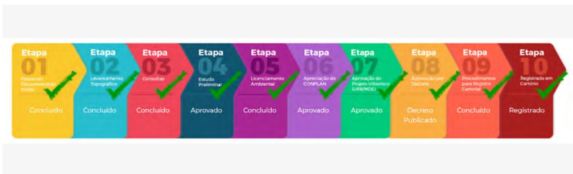
Figura 1 – Fluxograma das etapas da Reurb no DF.

Tanto a Lei Federal quanto o Decreto distrital preveem que a Reurb pode ser solicitada a partir de um Projeto Urbanístico que define, entre outros elementos, a poligonal da área pretendida para a Reurb e as características físicas, sociais e ambientais do local (Capítulo II, §1º). O artigo 2 do Decreto 42.269/2021 especifica que um dos objetivos da Reurb é de franquear a participação dos interessados. No entanto, não é especificado quem são os interessados, já que o morador, no restante do decreto, é designado pela palavra ocupante.