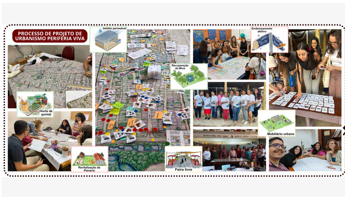
Figura 5 — Imagens do processo de projeto de urbanismo no Periferia Viva