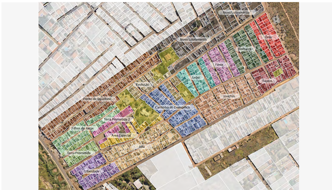
Figura 6 — Microrregiões do Assentamento Dorothy Stang