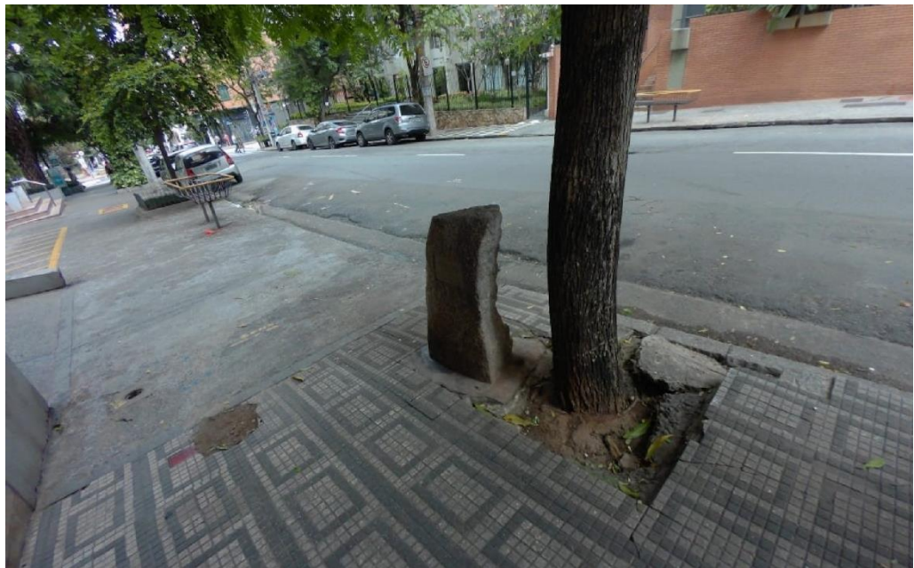
Figura 1: Monumento a Carlos Marighella.