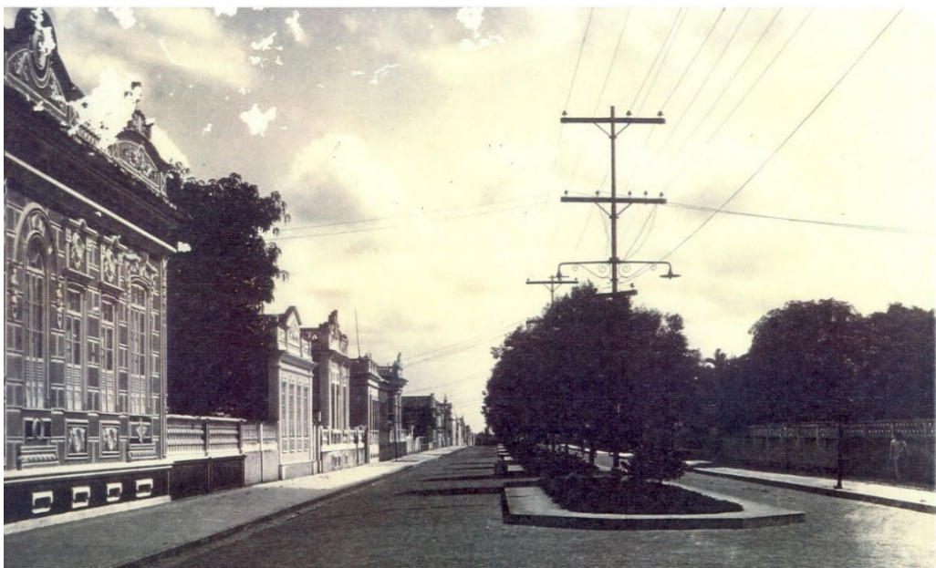
Figura 2: Avenida Senhor dos Passos.