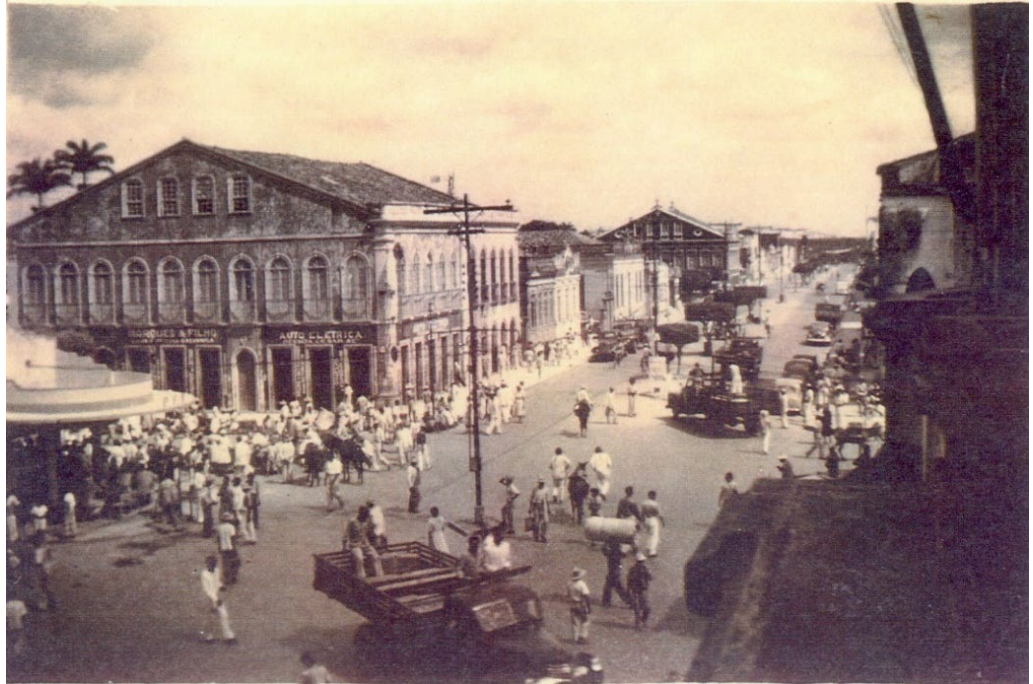
Figura 4: Feira livre nas proximidades do Mercado Municipal.

determinado padrão urbano, assim como a presença feminina no espaço da rua, devidamente acompanhada da figura masculina, o que indica a ideia de conformação entre sujeito e as regras sociais do ambiente urbano. Mas e quanto à feira livre das segundas-feiras, como ela foi apropriada pela fotografia de forma a não destoar da organização espacial imposta pela política de urbanização? Examinemos as imagens abaixo.