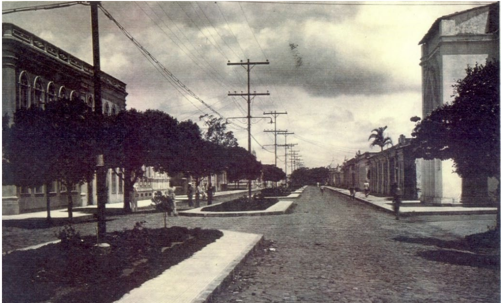
Figura 1: Avenida Senhor dos Passos.

Posto isto, atentemos para as imagens a seguir.