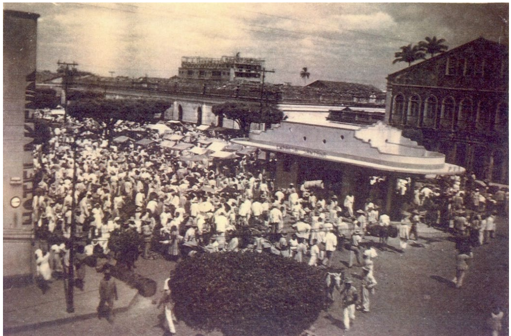
Figura 5: Feira livre próximo ao Mercado Municipal.