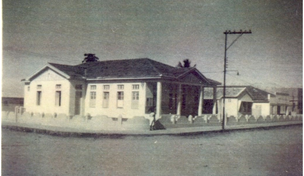
Figura 10: Casa com arquitetura adequada para o período citadino.