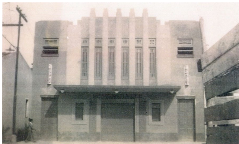
Figura 8: Cine Santana.