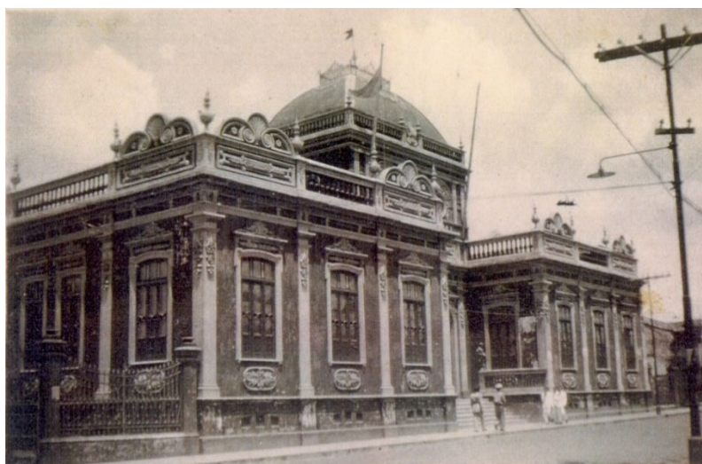
Figura 9: Escola Normal.