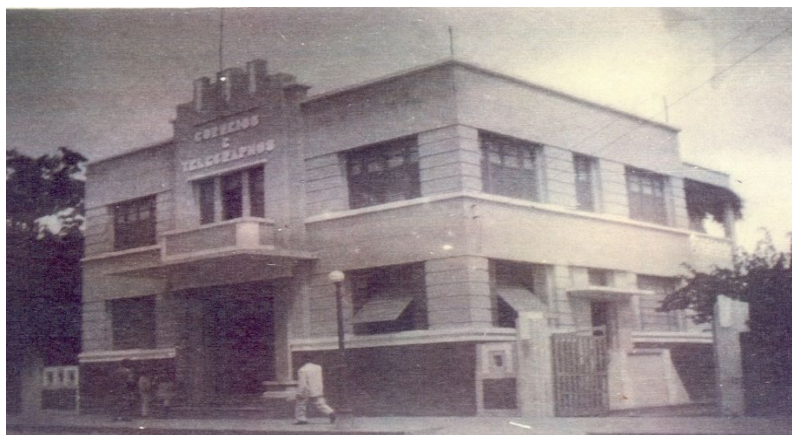
Figura 7: Prédio dos Correios e Telégrafos.