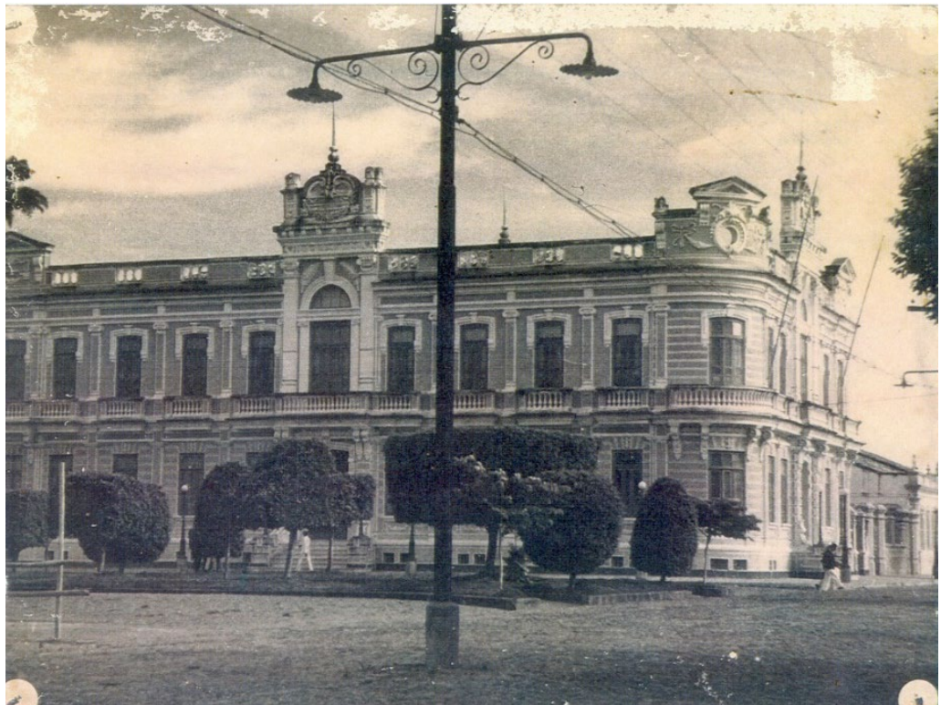
Figura 6: Paço Municipal.

Portanto, apesar de as fotografias espelharem certa ordenação nessa aglomeração do comércio da feira livre, o que os registros policiais revelavam na prática eram a desordem e as tentativas de contê-la, restringindo o que destoava dos objetivos da modernidade. Independentemente de suas motivações, tais registros se constituem como uma das poucas evidências dos sujeitos e práticas populares dissonantes. Para além dessas cenas urbanas, ainda podemos destacar as imagens a seguir (Figuras 6 a 10), com capturas do Paço Municipal, do prédio da empresa de Correios e telégrafos, do Cine Santana, do prédio Ginásial da Escola Normal, da arquitetura de casas em alinhamento com os padrões exigidos para edificações e das filarmônicas; que realçavam o crescimento e modernização do contexto urbano.