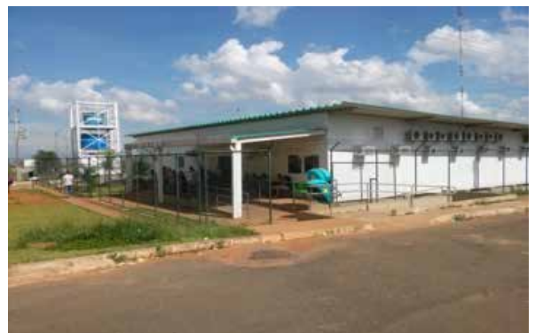
Figura 1b: Recorte fotográfico da Fachada Lateral - UPA de Samambaia