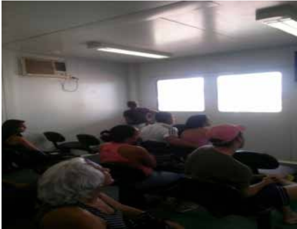
Figura 3: Recorte fotográfico da Sala de Recepção - UPA de Samambaia

a 5,0 TRs, resolução esta que não está sendo respeitada na unidade.