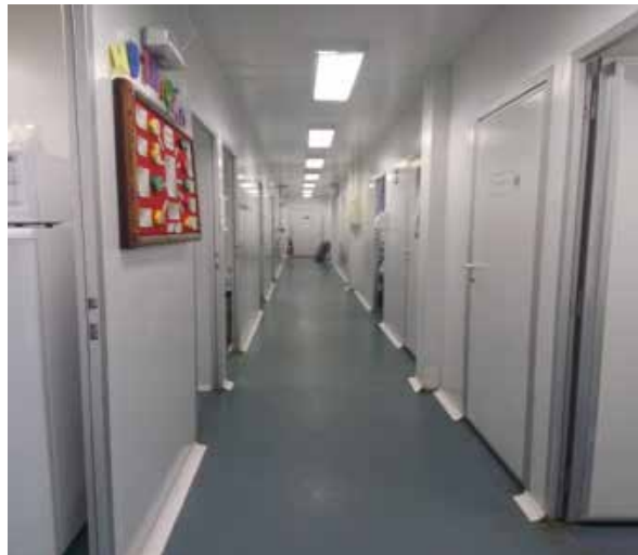
Figura 9: Recorte fotográfico da circulação interna - UPA de Samambaia

O conforto visual na UPA de Samambaia também é insatisfatório, tendo como cor predominante o branco. A cor branca traz um excesso de claridade para o local, fazendo com que o ambiente gere um cansaço mental para pacientes e servidores. A Unidade, além de possuir todos os ambientes internos pintados de branco, não possui a presença de iluminação natural, tornando assim o branco ofuscante devido a grande quantidade de iluminação artificial - Figura 9.