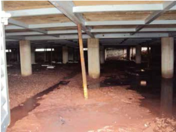
Figura 6: Recorte fotográfico da Fundação - UPA de Samambaia