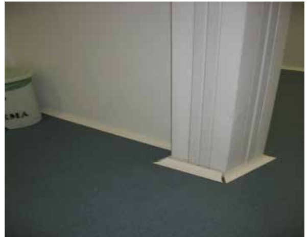
Figura 5: Recorte fotográfico da Sala de Espera - UPA de Samambaia

Observou-se também que um dos agravantes encontrados no ambiente é a forma de implantação e o material usado no piso. Devido à trepidação das macas, cadeiras de rodas e o intenso fluxo de pessoas, o piso da unidade apresenta ruídos e sensações de afundamento produzido pela circulação, vide Figura 5.