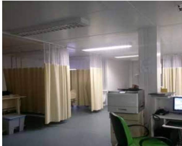
Figura 8: Recorte fotográfico da Sala Amarela - UPA de Samambaia