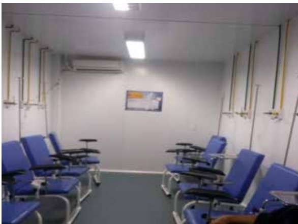
Figura 7: Recorte fotográfico da Sala de Recuperação - UPA de Samambaia

A falta de iluminação natural é agravada devido à inexistência de janelas nas salas internas do estabelecimento, conforme pode ser observado nas Figura 7 e 8.