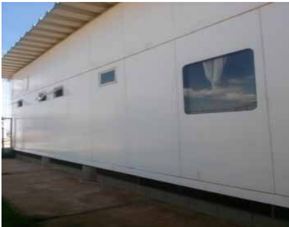
Figura 4: Recorte fotográfico da vista externa da Fachada Principal - UPA de Samambaia