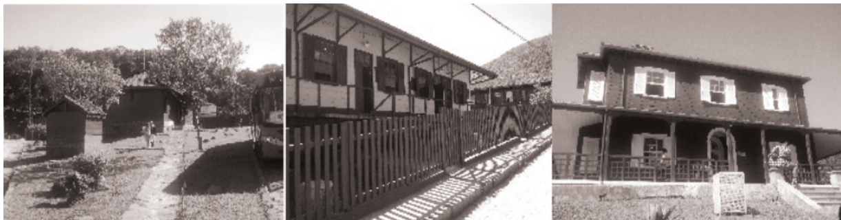
Figura 3: Casa Fox – CEDARQ – Casa do Engenheiro (Castelinho)