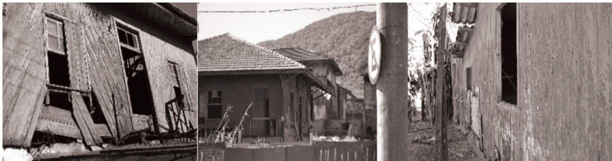
Figura 1: Casas abandonadas da Vila de Paranapiacaba