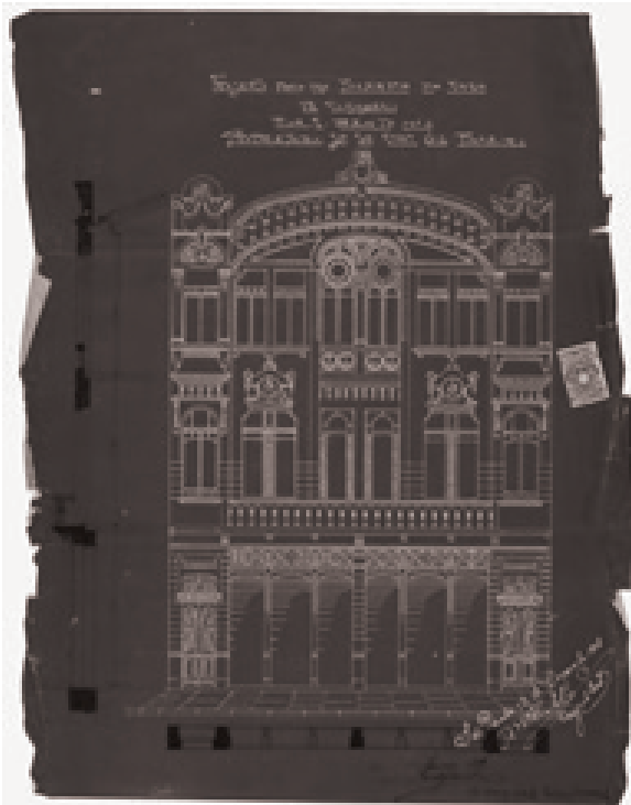
Figura 2: Projeto para Joaquim Gil Pinheiro. Arquiteto: Maximilian Hehl, Rua São Bento n. 2. Tipologia recorrente no centro, mesclando comércio e moradia