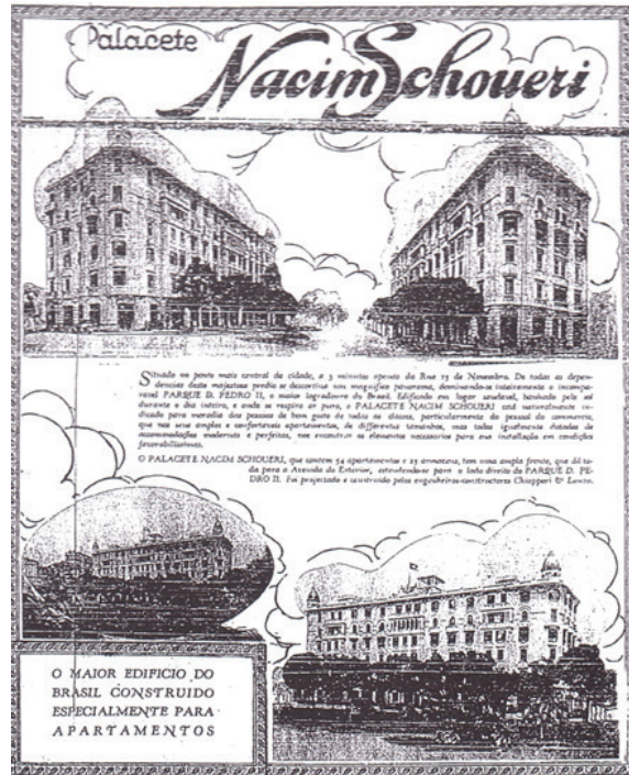
Figura 3: “Palacete Nacim Schoueri”. Edifício de apartamentos e lojas destinado principalmente ao “pessoal do comércio”.

A propaganda imobiliária veiculada nos jornais corrobora essa hipótese. O discurso publicitário buscava qualificar tais empreendimentos assemelhando-os a um “palacete” e aludindo ao discurso higienista, ideias associadas ao conceito de “progresso” e “modernidade” então em vias de afirmação. Interessante é o caso do “Palacete Nacim Schoueri”, construído em 1930, destinado “particularmente ao pessoal do comércio” – situando-se a “3 minutos apenas da rua Quinze de Novembro”. Embora destinado aos comerciantes, visava atingir “todas as classes”, muitas ainda não afeitas a esse novo programa de habitação coletiva.