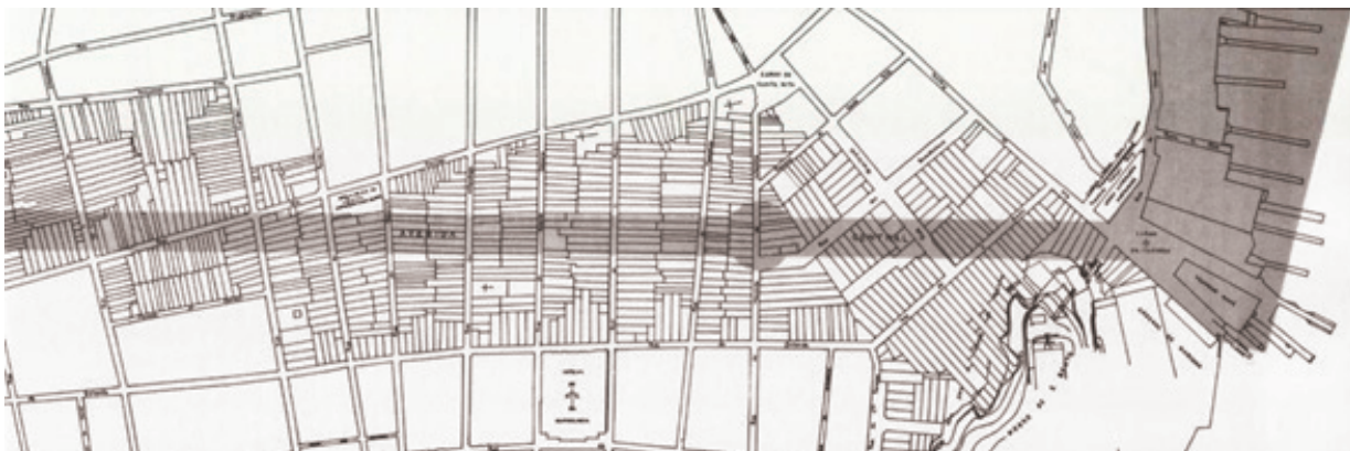
Figura 7: Detalhe do projeto de abertura da Av. Central. Em cinza a nova via a ser aberta, promovendo vultosa demolição do casario antigo.

Outras propostas que nasceram no século XIX, como a derrubada do Morro do Castelo e do Morro de Santo Antonio, só foram colocadas em