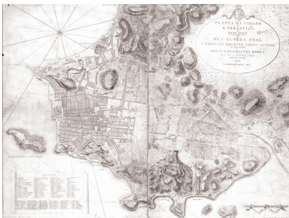
Figura 3: Mapa do Rio de Janeiro requisitado por D. João VI em 1808 e publicado em 1812.