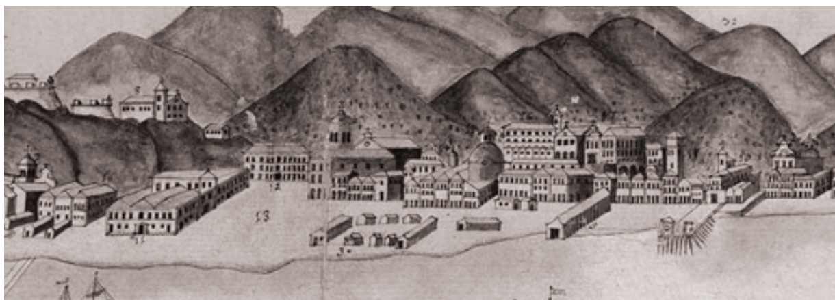
Figura 1: Vista do Largo do Carmo em 1775.