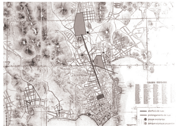
Figura 6: Síntese das propostas da Comissão de Melhoramentos sobre a planta geral da cidade de 1875.

Somente uma pequena parcela das propostas começou a ser colocada em prática