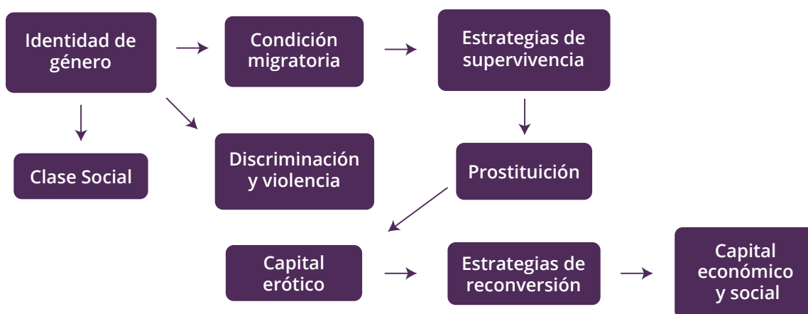
Diagrama 2: Principales características del segundo tiempo migratorio