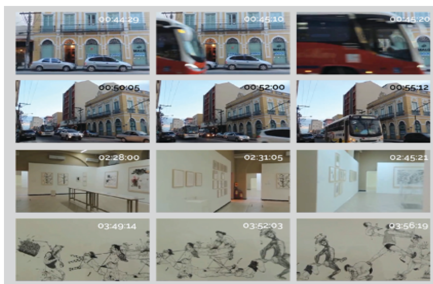
FIGURA 8 – Fotograma do vídeo de 10 minutos “Amor e arte, o Filme”, Museu Leopoldo Gotuzzo.

O terceiro e último grupo, que observou o MALG, produziu o vídeo “Amor e Arte, o filme” (Figura 8), em que mostra a cidade e seu turbilhão. O audiovisual começa mostrando cenas da cidade, especificamente a rua do museu, com seu fluxo quase ininterrupto de automóveis e pedestres. Utilizam uma trilha sonora bem agitada para mostrar essas cenas, até entrar no museu quando a música se torna calma. Eles percorrem o museu e observam as obras de arte que ali se encontram, a música relaxante acompanha o visitante até a saída.