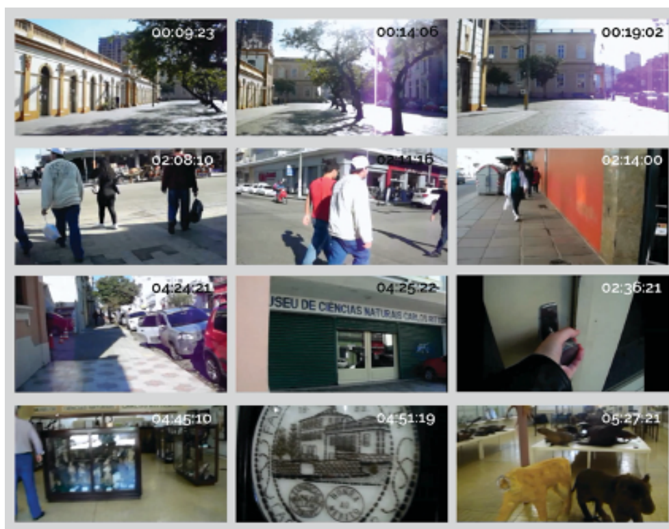
FIGURA 6 – Fotograma do vídeo de 10 minutos “Caminhos”, Museu Carlos Ritter.

Outra questão que se pode destacar no vídeo é a importância do caminhar para o urbanismo contemporâneo. Ressalva para as derivas, ao caminhar sem rumo. Observar, sentir, se perder, conhecer lugares diferentes. O caminhar como resistência.