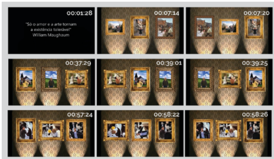
FIGURA 5 – Fotograma do vídeo de 1 minuto “Amor e Arte”, Museu Leopoldo Gotuzzo

A primeira montagem, mais curta, não exigia tanto cuidado para obter a atenção do espectador. Já nesta nova montagem de aproximadamente dez minutos, os alunos precisariam desdobrar seu olhar, perceber algo para além de uma primeira impressão. Seria necessário sentir o movimento, sentir o impulso criador atuando livremente para apreender o olhar do interlocutor.