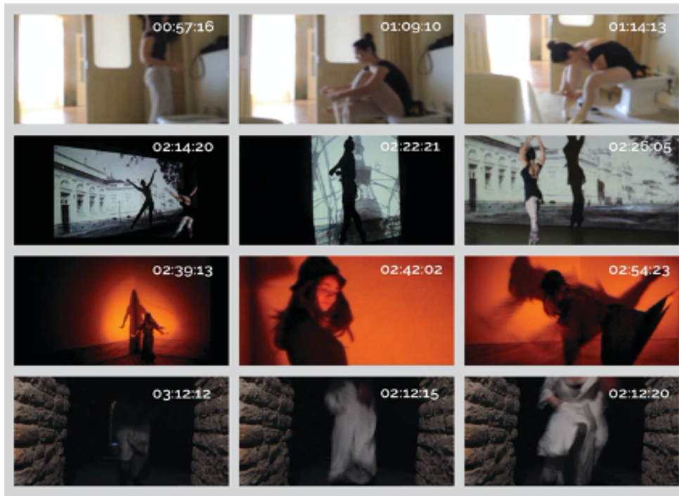
FIGURA 7 – Fotograma do vídeo de 10 minutos “Paralelos”, Museu do Doce

podem ser espaços ativos para seus visitantes. Um espaço para dançar ou tocar instrumentos, lugar do encontro e de novas experimentações.