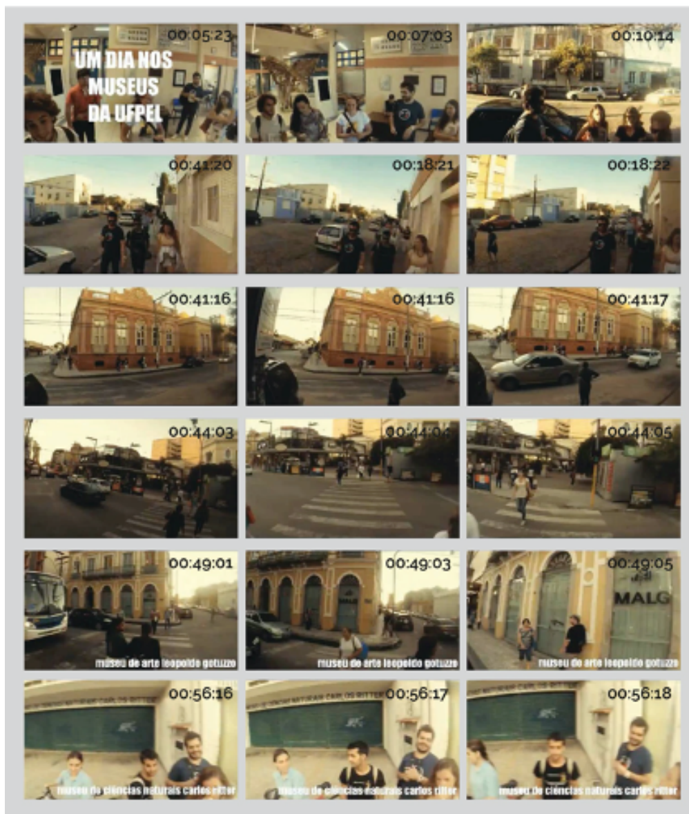
FIGURA 2 – Fotograma do vídeo “Um Dia nos Museus” produzidos pelos autores.

O grupo de estudantes produziu peças fílmicas versando a temática “Museu e Cidade”. O primeiro audiovisual foi produzido no primeiro encontro do grupo. Uma time-lapse do caminho percorrido da universidade até o centro da cidade, onde se localizam os museus (Figura 2). Passamos pelos três museus, criamos um primeiro percurso, percebemos cenas da cidade, o trânsito dos automóveis e o fluxo das pessoas, a maioria delas bem apressadas, num movimento quase automático.