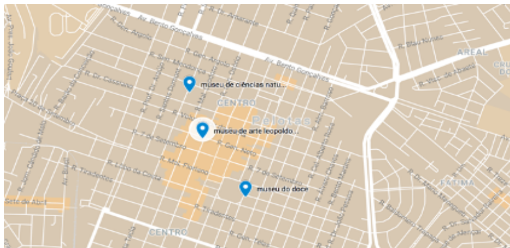
FIGURA 1 – Localização dos Museus na cidade de Pelotas.