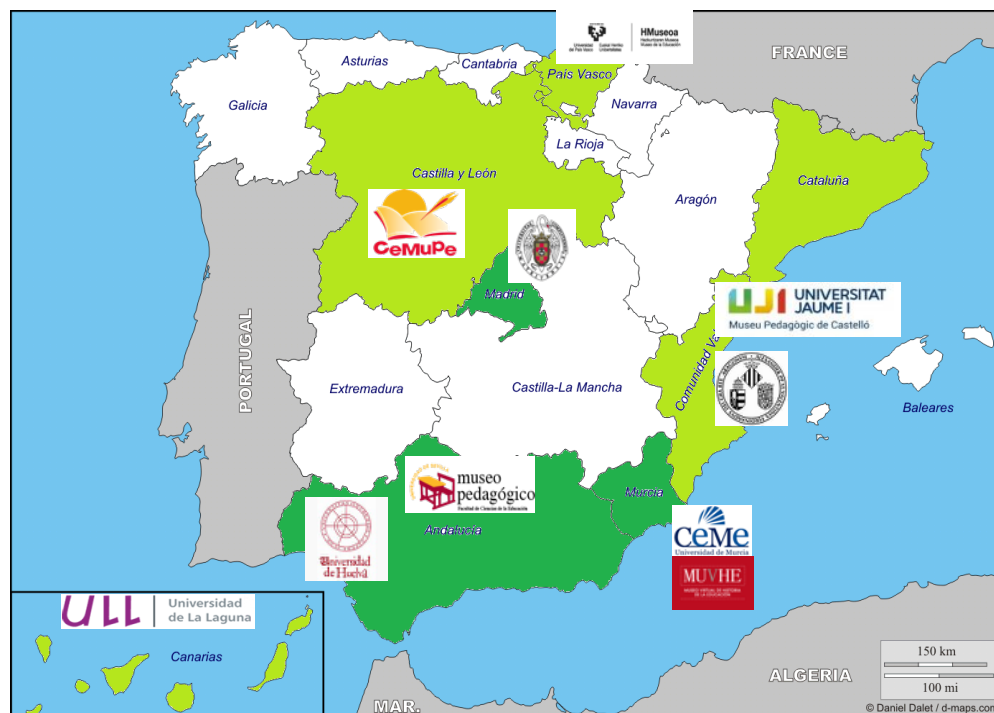
Gráfico 2.- Situación de los museos de la educación dependientes de las universidades