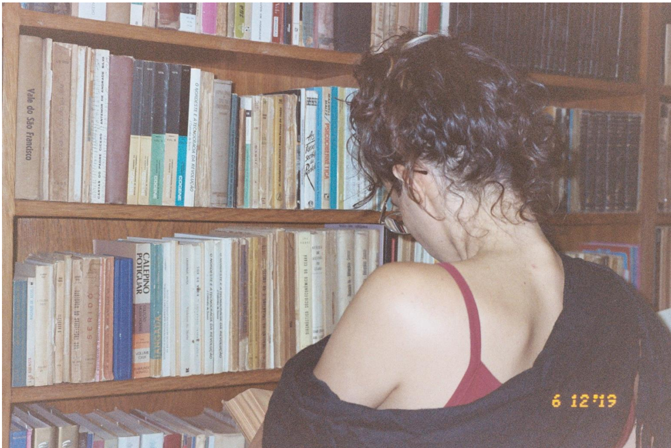
Registro de ação na Biblioteca da Casa do Ceará. 2019

Um galho comprido brotava do centro das minhas costas, crescia em círculo e passava por baixo do meu braço esquerdo. Perguntei ao meu marido o que significava aquilo. Ele declarou: É a árvore da vida. Repliquei: Creio que está crescendo para o lado direito também. Resolvemos chamar um médico da família já falecido para operar. Ele tinha o aspecto de um querubim. Cumprimentei-o afetuosamente. Aplicou um anestésico, operou-me e fiquei surpresa com a rapidez de minha convalescência. Então ele aconselhou-me a não levantar peso durante 9 meses.