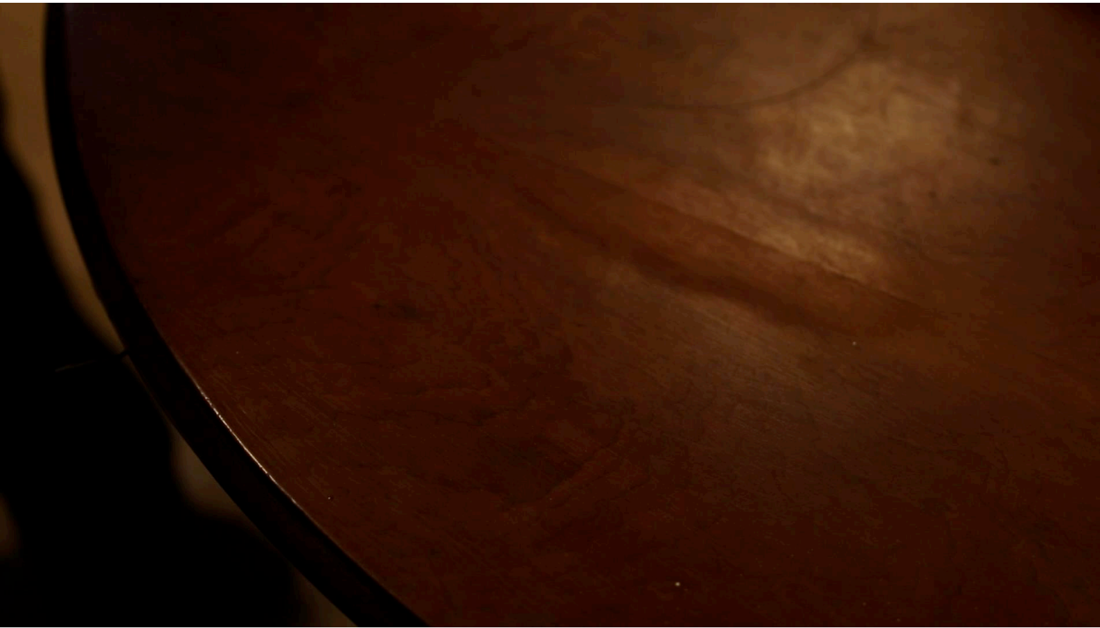
Vídeo - registro de ação na Biblioteca da Casa do Ceará. 2019 https://vimeo.com/453288484

Com sofreguidão respirou fundo o ar do planalto e encheu de amplidão os olhos, tentando num relance visualizar a paisagem inteira. Me habituei aos caminhos limitados plenos de fronteiras. Piso neste chão e confesso que cometo sacrilégio. E levantou-se com os olhos marejados.