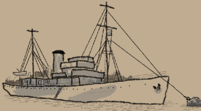
Embarcação HMS Challenger

Novembro, 2020 | 15°47'48.9"S 47°47'09.8"W